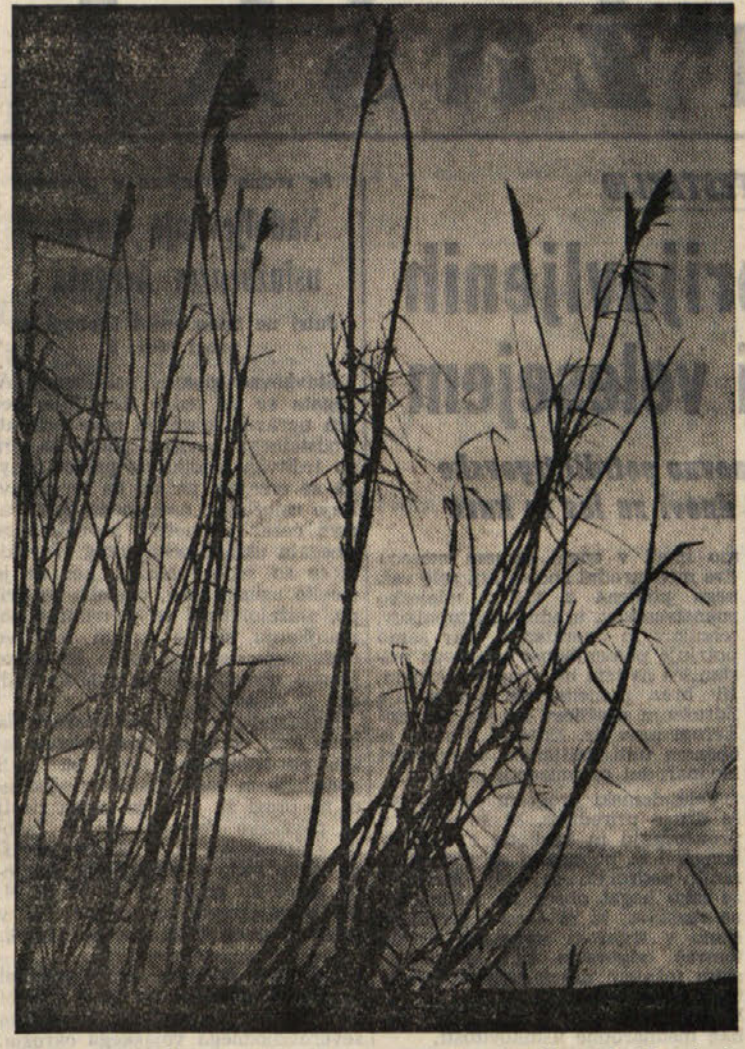
PRED MRKOM

«Skoraj pol stoletja je minilo od trenutka, ko se je začela oktorska revolucija. Toda ta dogodek še vedno vzbuja zanimanje vsega človeštva. Angleško ljudstvo, kot vsi drugi narodi, se močno zanima za zgodovino rojstva sovjetske države.»