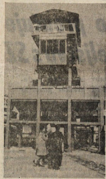
Jeklen stolp, izdelek veronske tovarne S.I.M. prevzema, meša, zakatranira ter nalaga na tovornjake po 70 ton gramoza, pripravljena za polaganje na novo cestišče, na uro. Naprava, ki ne potrebuje druge moči kakor tehnika pri komandnem pulsu, stane 42 milijonov lir

dobna dela. Do leta 1970 naj bi Italija imela že 5.000 km avto cest, da ne omenimo super cest in navadnih cest, ter cestnega omrežja nižje kategorije, ki pa ga je treba stalno vzdrževati in izboljševati. Industriji pa računajo tudi na ponoven razvoj gradbeništvu, ki se zdaj počasi rešuje iz krize, in ki mora potajni vse dotlej, dokler ne bo za vse italijansko prebivalstvo poskrbljeno dovolj primernih stanovanjskih prostorov v mestih in na deželi, za naraščajoč domači in tuji turizem pa dovolj kapacitet, dovolj novih cest, železnic, letališč in drugih potrebnih naprav. Samo državne železnice bodo do