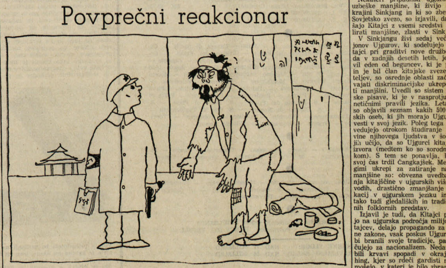
«Morda sem prekleli buržo, toda verjam mi, nisem imperialist»

Odobrili so delovni načrt za leto 1967 in ukrepe za nadaljnji razvoj sodelovanja med socialističnimi državami na trgovinskem sektorju.