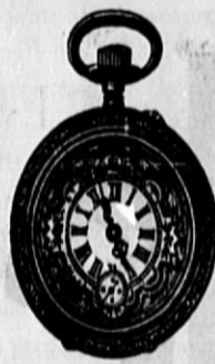
Št. 505. Prava srebrna silinder-remonoar, trpežno kolesje in močni pokrovi, gl. 485, ista z dobrim ankerkolesjem gl. 595 in naprej.