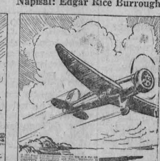
Potegnil je za vzvod: koleša so z močjo udarila ob tla in v naslednjem trenutku je bilo letalo že mimo nevarnih ovir ter mirno plulo precej višje v zraku in se dvigalo višje in višje. Prestala sta prvo oviro in Brown je odjahnil. Ne pa tako Tarzan, kajti pred seboj je videl še hujšo nevarnost, ki jima preti.