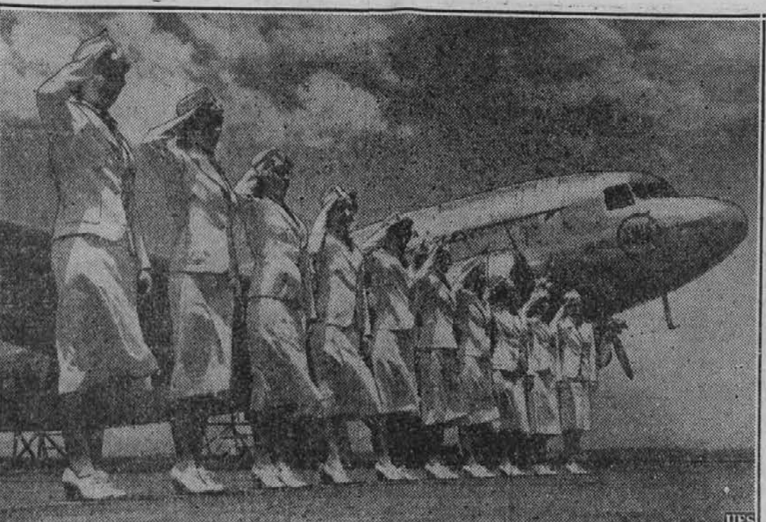
Deset strežkinj na potniški h aeroplanih družbe Transcontinental and Western airline, od katerih je vsaka preletela z aeroplanom najmanj četr milijona milj. Slika je bila vzeta v Kansas City.