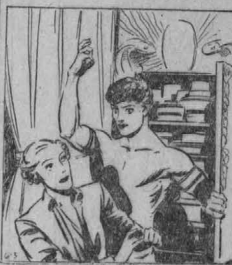
S tem, da se je Lady Greystone uprla divjaku Kavadandavandi, je se bolj razvnela njegovo jezo. Divja krevlečnost je zopet zmagala v njem.