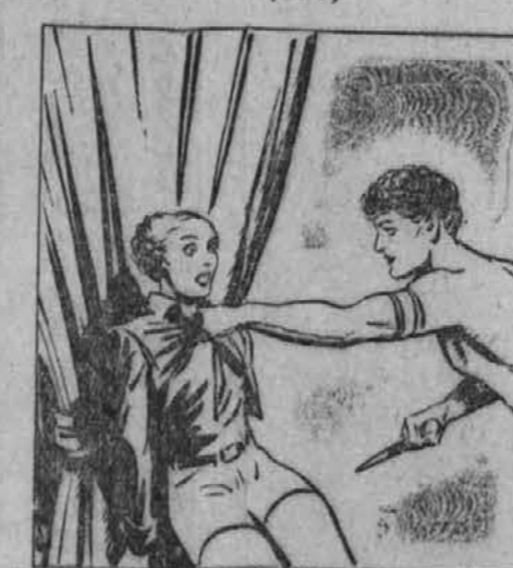
"Plačala boš svoj upor proti meni!" Obrnil se je in vzeli iz omare neko posodo, v kateri so bile raznovrstne stvari. Izbral je nekaj in kazal govorec: "To so posledice in posledice skrivnostnim elektricnim večim mlačnosti, katerih najvažnejši del je kri mladih žensk. Tudi tvoja bo polnila te posode!"