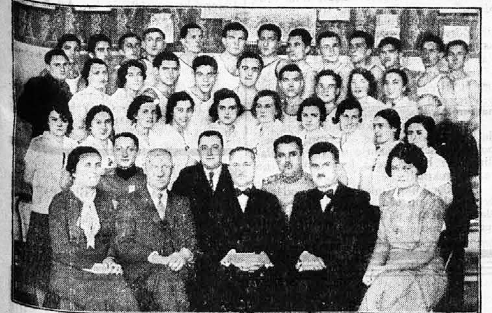
Župski prednjački tečaj župe Kragujevac

Treći tečaj je bio prvi tečaj ove vrste u Savezu, jer na njega su bilo pozvate samo žene iz sokolskih četa. Tečaj je bio tehničko-prosvetni. Na te-