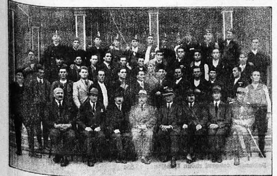
Župski tečaj za vođe sokolskih četa župe Kragujevac

čaju su bile: 4 učiteljice, 4 gradanke i 21 seljanka, od kojih 3 preko 40 godina. Tečaj je trajao svega 4 dana, jer je to bila jedna vrsta pokušaja, da li se takav tečaj u opšte može održati i da li će biti odziva i koristi od njega. Može se slobodno reći, da je pokušaj uspeo iznad očekivanja. Tečajke su bile neobično vredne i marljive i za sve se interesovale, i to naročito baš one starije. S tehničke strane dato je tečajkama najnužnije znanje iz prostih vežbi, strojevnih vežbi i igara, a s prosvetne strane o Sokolstvu, higijeni že-