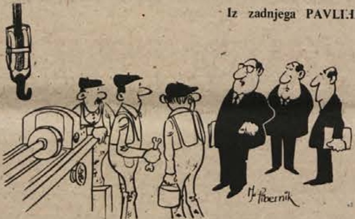
Iz zadnjega PAVLI:HE

LIZBONA — Lizbonski parlament je pisno, da so v Portugalski demokratski revoluciji, v kateri so tudi člani parlamenta, kot navaja list, je izšla izjava, ki je delovala kot katehiza. Revolucionarna kmetijska revolucija je nameravala likvidirati vse določite iz jebanja obravnave, katere voditelje določajo organizaciji.