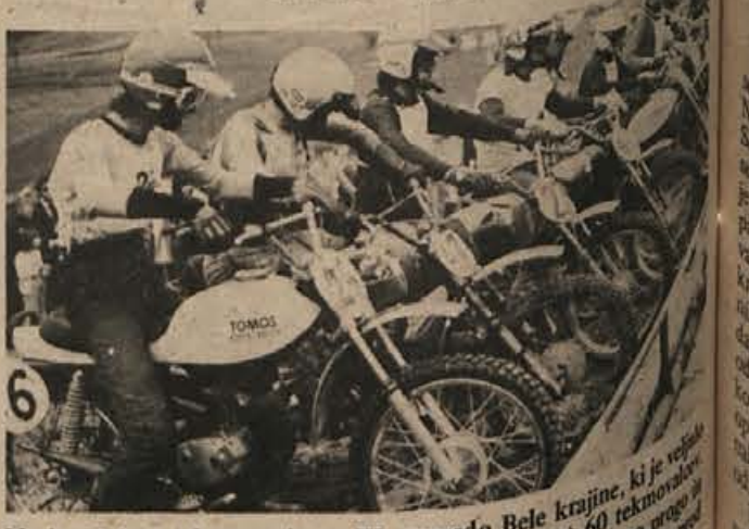
Na letošnjem tekmovanju za III. nagrado Bele krajine, ki je vsako leto v državnem prvenstvu, je nastopilo več kot 60 tekmovalcev. Skoraj vsi so pohvalili organizatorje in odlično speljano progo na obljubili, da bodo Dragovanje vas se pristi. Na sliki: priprava na startom.

Rezultati: 1. Zrimšek (Novo mesto) 1:57,13, 8. B. Mijalovec (Novo mesto) 29 sekund zaostanka za prvomestnim. Tudi med ekipami so prvomestni odlični vozili, saj so novomeščani odlično vozili v slovenski j. goslovskih klubov. Rogovci pa so je osvojili prva Rogovci (5:53,22), drugi pa so bili Novomeščani (5:53,32).