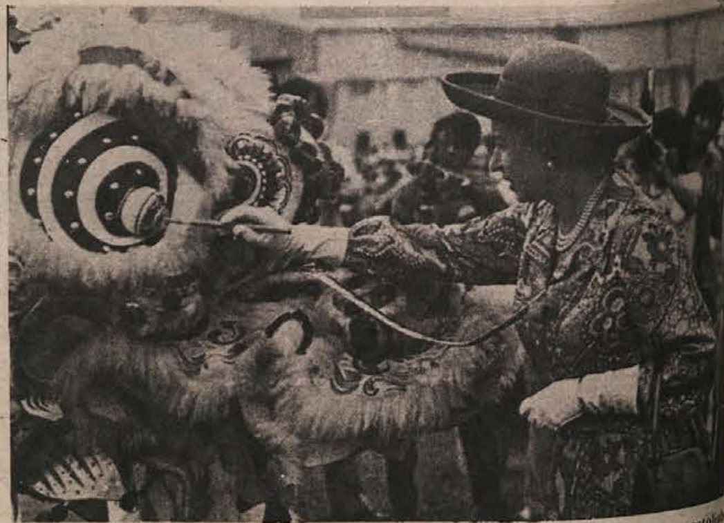
HONG KONG — Tu se mudi britanski kraljevski par na uradnem obisku. V program so gostoljubni domačini uvrstili tudi obisk neke folklorne revije, med katero je morala kraljica Elizabeta II. pobarvati oko velike maske, ki je potem nastopila na prireditvi. Na sliki: britanska kraljica Elizabeta II s čopičem v roki v Hong Kongu.

samo zato, ker so pač kmetje. Delavci pa lahko imajo več tozdov. Ali kmečka proizvodnja ne more biti zaokrožena na manjših območjih tako, da bi lahko ugotavljali dohodek? Seveda je lahko. Ali so kmetje zaupanja manj vredni samoupravljalci kot delavci? Po predpisih in ustavi