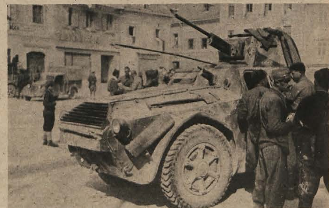
SPOMIN IZ DNI OKUPACIJE: zaplenjeno italijansko oklopno vozilo na Glavnem trgu v Novem mestu.