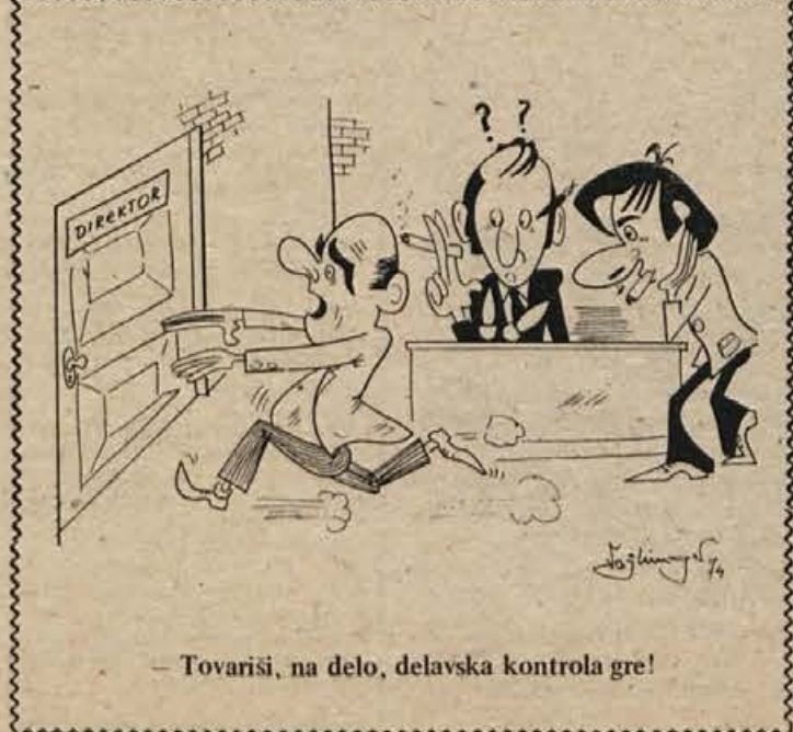
- Tovariši, na delo, delavska kontrola gre!

Zakon o regresih za skupinska potovanja otrok in mladine zagotavlja letem pri skupinskih potovanjih 30 odstotkov regresa od polne cene prevoza. Nadaljnjih 30 odst. komercialnega popusta dajejo prevozna podjetja po posebni pogodbi, tako da znaša celoten popust 60 odstotkov od cene prevoza.