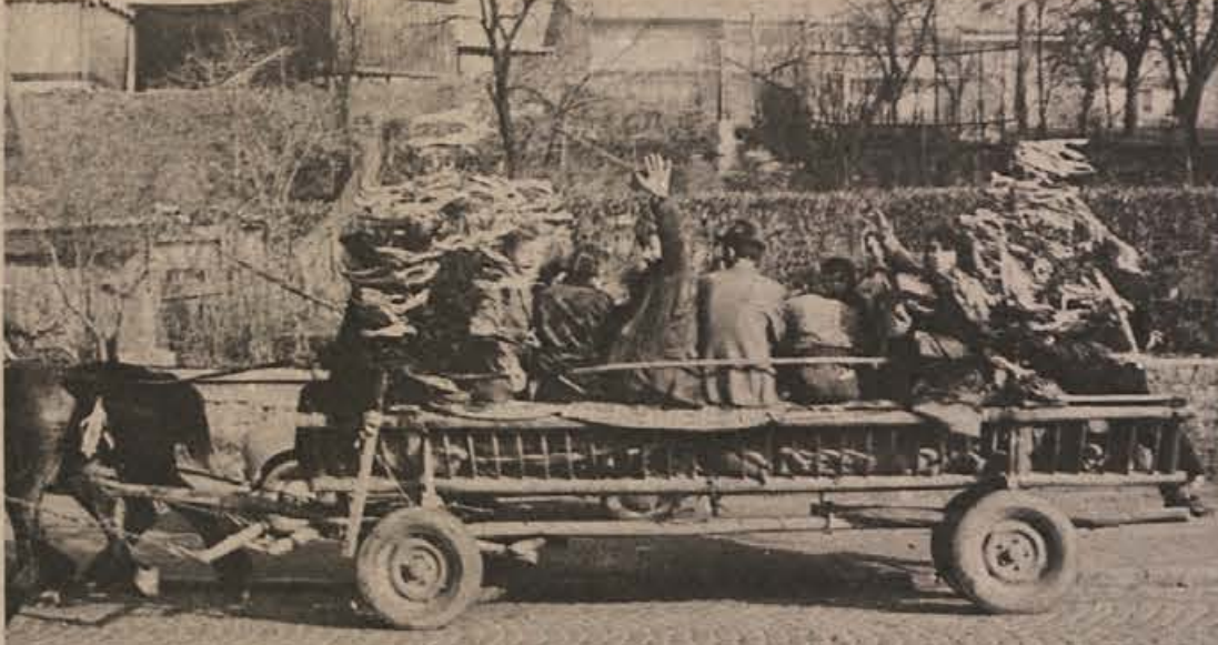
„Oh, adijo, ljubca moja, jaz pa moram bit soldat...“ so peli tile na fotografiji precej „pod gasom“. Podobne prizore v Novem mestu še vidavamo, čeprav so redkejši kot včasih. Zadnje čase imajo fantje navado celo avtomobile okrasiti z različnimi pisanimi trakovi in zadnji dan proslavljati po gostilnah. Kako s tem sebe in druge spravljajo v nevarnost, ne mislijo. Taka lahkomišelnost pa se včasih konča namesto v vojaški suknji na bolniški postelji ali pa pred sodiščem.

Začasne duševne motnje so prehodna psihična stanja, izzvana z različnimi vzroki, v katerih so motene psihične funkcije, ki pa lahko dosežejo takšno stopnjo, da onemogočijo dojemanje pomena dejanja. Lahko nastopijo kot posledica psihoze, visoke telesne temperature, pretresa mozgan, zastrupitve, šokov (živčnih pretresov). Zaostali duševni raz-