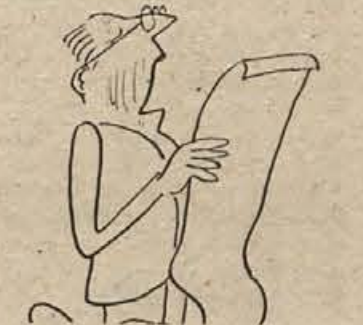
Našel bom le nekaj bistvenih razlogov... (Karikatura: Andrej Novak)

okviru Nanosa lahko prodati. Podatki prvega četrtletja tudi kažejo, da se je uspeh novomeške konfekcijskega podjetja močno popravil, še boljše rezultate pa pričakujejo v naslednjih mesecih.