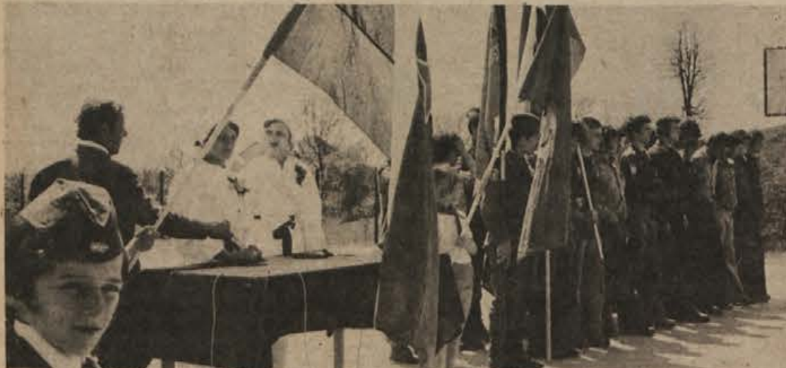
Na Vinici so 30. aprila opoldne svečano sprejeli kurirsko pošto s pozdravi in željami maršalu Titu za rojstni dan, hkrati pa je šolska mladina pripravila kulturno prireditev, ki se je udeležila tudi mladinska brigada iz Ljubljane, mesta herojev. Brigadirji so šli po poti političnega vodstva NOV in POS in so ta dan prišli tudi na Vinico.

V nedeljo ob 10. uri bo v Okroglicah pod Lisco spominska svečanost, s katero želijo družbenopolitične organizacije in krajevna skupnost Loka pri Zidanem mostu obuditi spomin na dogodek, ko so fašisti leta 1944 uničili kurirsko postajo v Prašnikarjevi hiši, v decembru pa je bila nato požgana vsa vas. Spominska plošča na Prašnikarjevi hiši bo tudi cilj partizanskega pohoda skupin iz Loke in Razborja.