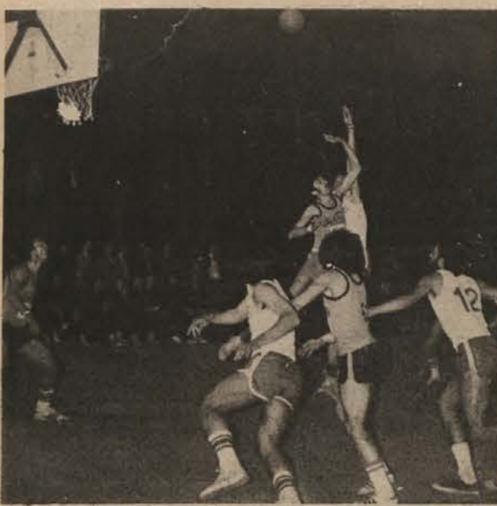
Košarkarji v prvi slovenski košarkarski ligi A so včeraj odigrali tretje kolo. Vse tekme do sedaj so dokazale, da so se ekipe na novo tekmovalno sezono dobro pripravile, kar obeta kvalitetno košarko. Poznavalci napovedujejo, da imajo v letošnjem prvenstvu največ možnosti za prvo mesto ekipe Ilirije, Triglava in Kovinotehne. Na sliki: trenutek s prvenstvenega srečanja med Beti in Ilirijo. Z malo več športne sreče bi Metličani lahko zmagali.