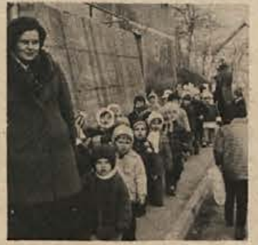
Vendarle perspektiva za cenejša mladinska potovanja

morali pred podpisom sporazuma rešiti še nekaj perečih vprašanj. Gre za združevanje lekarn, povezovalne strokovnih služb Zavoda za socialno zavarovanje in bodočo pripadnost TOZD Zdravstveni dom v Krškem in tamkajšnje lekarne. Predlagajo, naj bi se na medobčinski ravni sporazumeli, ali naj bi ti dve krški delovni organizaciji ostali v dolenjski regiji ali pa se priključili organizacijam v Posavju. Smotri, ki naj bi jih dosegli s tem povezovanjem, so na dlani: boljša kvaliteta dela, nenehno sodelovanje strokovnih služb osnovnega, specialističnega in bolnišničnega zdravstvenega varstva občanov ter - ne nazadnje - uskladeno delovanje na podlagi delitve dela in boljše organiziranosti. Poudariti pa velja še ekonomski smoter: združevanje sredstev za naložbe v zdravstvene objekte, medicinsko opremo in seveda kadre.