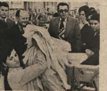
Novomeški Labod (na sliki) pomaga iz težav podjetju TIP-TOP.

Tri TOZD ljubljanskega podjetja TIP-TOP (Trebneje, Ljubljana in Idrija) so od prvega maja vključene v delovno skupnost novomeškega Laboda. Pripojitev so potrdili neposredno pred tem zbori delovnih ljudi v Labodu in TOZD TIP-TOP. Vse to je v skladu s sanacijo ljubljanskega podjetja, ki je lani končalo poslovno leto s 44 milijoni dinarjev izgube. V sanacijo se je vključil tudi Labod.