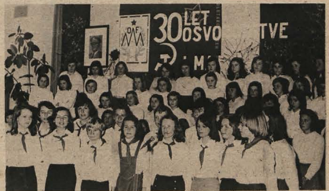
Proslava v počastitev 30-letnice osvoboditve in praznika dela je bila na osnovni šoli v Kočevju 30. aprila. Udeležili so se je tudi predstavniki družbenopolitičnih organizacij občine Kočevje.