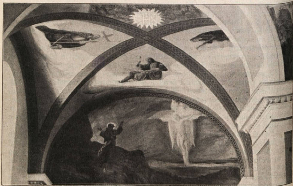
Sv. Frančišek prejme rane. (God 17. sept.)

Svojo veliko ljubezen do Jezusa je sv. Frančišek črpal tudi iz premišljevanja njegovega bridkega trpljenja. Malo je svetnikov, ki bi bili toliko in s takšno slastjo premišljevali Kristusovo trpljenje in smrt, kakor je to storil sv. Frančišek. Kristus sam ga je bil vpeljal v to premišljevanje. Sv. Bonaventura pripoveduje namreč, da se mu je v začetku njegovega bogoljubnega življenja „nekega dne prikazal Jezus Kristus, Križani. Ob tem pogledu se je njegova duša raztopila v ljubezni in spomin na Kristusovo trpljenje se je vtisnil tako globoko v njegovo srce, da je v bodoče komaj zamogel misliti na Kristusa na