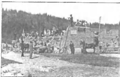
SICER JE VEČKRAT OBJAVLJENA FOTOGRAFIJA PRIKAŽUJE ČLANE PARTIZANA SLOVENIJE PRI GRADNJI PROSVETNEGA DOMA V TRZINU

na zbor krajanov, naj nam pokažejo, da ta dom ni naš, saj je sodišče tako ugotovilo. Saj smo dali pritožbo na to isto sodišče in bi lahko vedeli, da ni vse tako kot piše v zemljiški knjigi, toda kdo se briga na sodišču za pravico ljudi, za njih je paragraf zakon, ludi če z njim narediš ne-popravljivo krivico. Kaj bo ŠUS res dokončno pokopal več kot tridesetletja prizadevanj velike večine Trzincev? Najmanj kar od Občine lahko pričakujemo je, da sodno ovrnednoli vsa