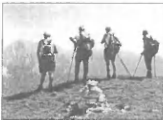
Na vrhu Kompetele