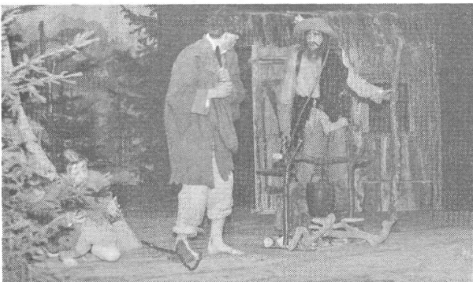
Prizor iz Kekca