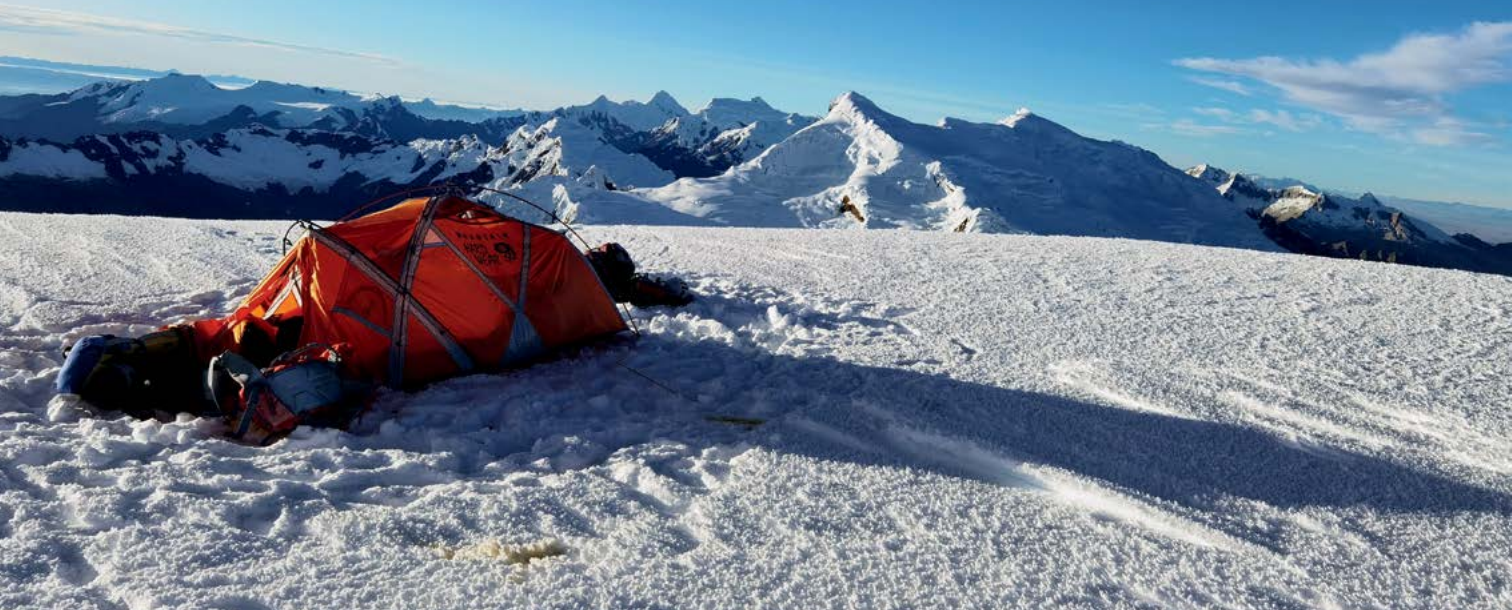
Udobje šotora