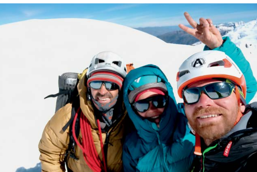
Veselje na vrhu

rakaste lepoticе. Noč v divji pokrajini je bila čudovita, razen tulcev, ki so ostali od strelav divjih lovcev, ni bilo nobene sledi o ljudeh. Le mi in neskončno nebo, polno zvezd. Ob prijazni uri smo se zbudili v prelepo jasno jutro, saj se nam nikamor ni mudilo; ta dan še ne bomo plezali. Po treh urah dostopa do ostenja smo našli idealno izravnavo za šotor tik pred začetkom naše zamišljene smeri, hkrati pa smo imeli veliko časa za ogledovanje dogajanja v steni. Zvoki, ki so nastajali ob kršenju serakov, so nas pretresli do kosti, kar pa nas ni ustavilo, da ob večernem "nažiranju" z odvečno hrano ne bi naredili dokončnega načrta.