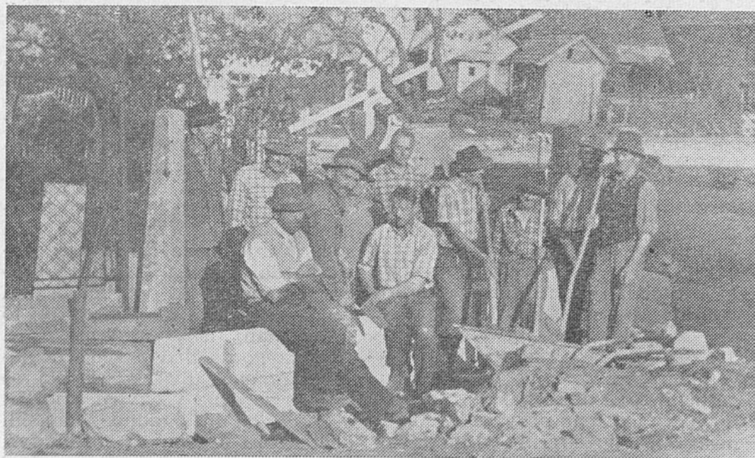
Videti je, da si je krajevni odbor Unec mnogo prizadeval za ureditev zunanjega izgleda vasi. Tako so vaščani pred kratkim dokončali cvetlični park pred Zadržnim domom in uredili okolico spomenika padlim borcem.