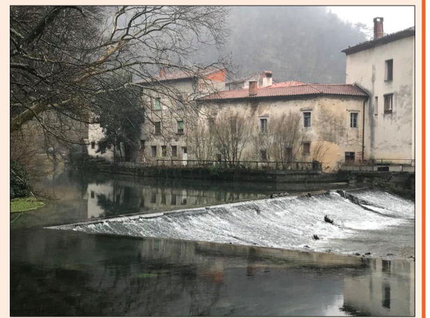
Vipava, Baumkircherjev dvorec (turn) danes. Nahaja se v bližini enega od izvirov reke Vipave (edini delta izvir v Evropi). Pri ostalih tega dvorca je družina Lanthieri v 17. stoletju začela graditi nov grad in palačo.