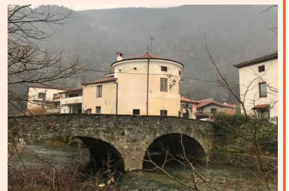
Družini Baumkircher sta bila v Vipavi leta 1401 podeljena v fevd dva stolpasta dvora, ki so ju med 13. in 14. stoletjem zgradili oglejski ministeriali. Komplex je tako dobil ime Baumkircherjev turn. Proti koncu 15. stoletja je bil vključen v tabor, ki so ga postavili kot obrambo pred turškimi vpadi. Obzidje se je v glavnem ohranilo do današnjih dni in domačini imenujejo še obstoječi stolp Baumkircherjev turn ali Tabor (ali tudi Spodnji grad). Stoji v bližini kamnitega mostu čez Vipavo.

(tudi v povezavi s hrvaškim plemstvom), medtem ko drugi nečak, baron Žiga Herberstein iz Starega gradu nad Vipavo, je bil diplomat, vojak in pisatelj, znan po tem, da je tudi zaradi znanja slovensščine postal habsburški veleposlanik pri ruskem carju Ivanu Groznem.