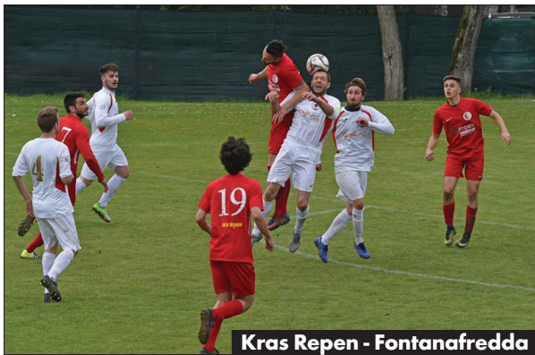
Kras Repen - Fontanafredda

D ve enajsterici sta še v igri, že zdaj pa je jasno, da je bila članska nogometna sezona pri nas, milo rečeno, katastrofalna. Najprej o moštvi, ki jih vrhunec še čaka. V nedeljo si bo Mladost v Špetru proti Valnatisoneju v dodatni tekmi play-outa za obstanek reševala kožo v promocijski ligi. Doberdobci morajo zmagati, drugače bodo nazadovali v prvo amatersko ligo. Druga junija pa bo Primorje, drugouvrščeno po rednem delu B skupine promocijske lige, igralo finale play-offa za napredovanje v elitno ligo. Če bodo Prosečani dosegli prestop, bodo v prihodnji sezoni edini zastopniki slovenskega nogometa v Italiji v najvišjem dežel-nem prvenstvu. Smo namreč pri bolečih razpletih, teh je bilo ničkoliko. Četudi s prednostjo domačega igrišča v finalu play-outa sta Juventina in Kras izgubila dodatni dvoboj za obstanek in izpadla iz elitne v promocijsko ligo. Oboji bi se lahko rešili brez dodatkov že v zadnjem krogu rednega dela, ko bi le zmagali doma. A ni se jim izšlo in nato so zatajili tudi v nedeljo v play-outu, Juventina proti Flaibanu (0: 1), Kras pa proti Fontanafreddi (1: 2). V Repnu so se morali sprijazniti z vrtnitvijo v promocijsko ligo po polnih de-