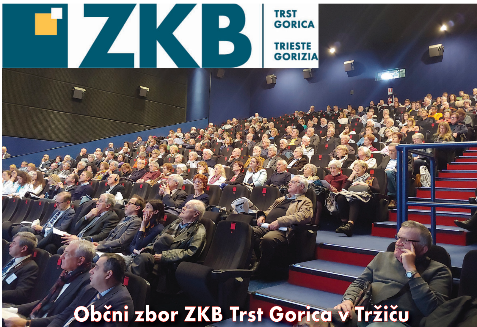
Občni zbor ZKB Trst Gorica v Tržiču