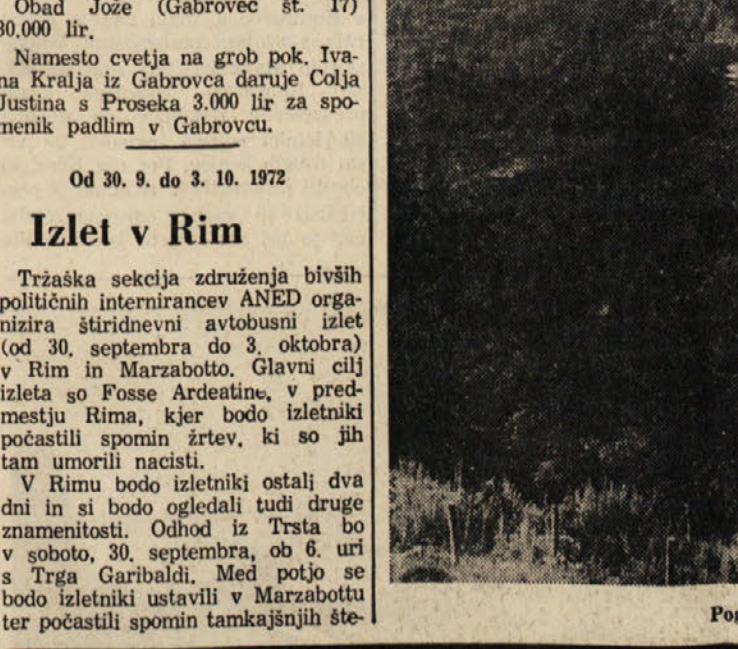
Pogled na zaselek Kortino v slovenski Istri.

Občina KMEČKI TABOR na Općine, kjer se boš v senci in domačem razpoloženju dovolj pozabaval!