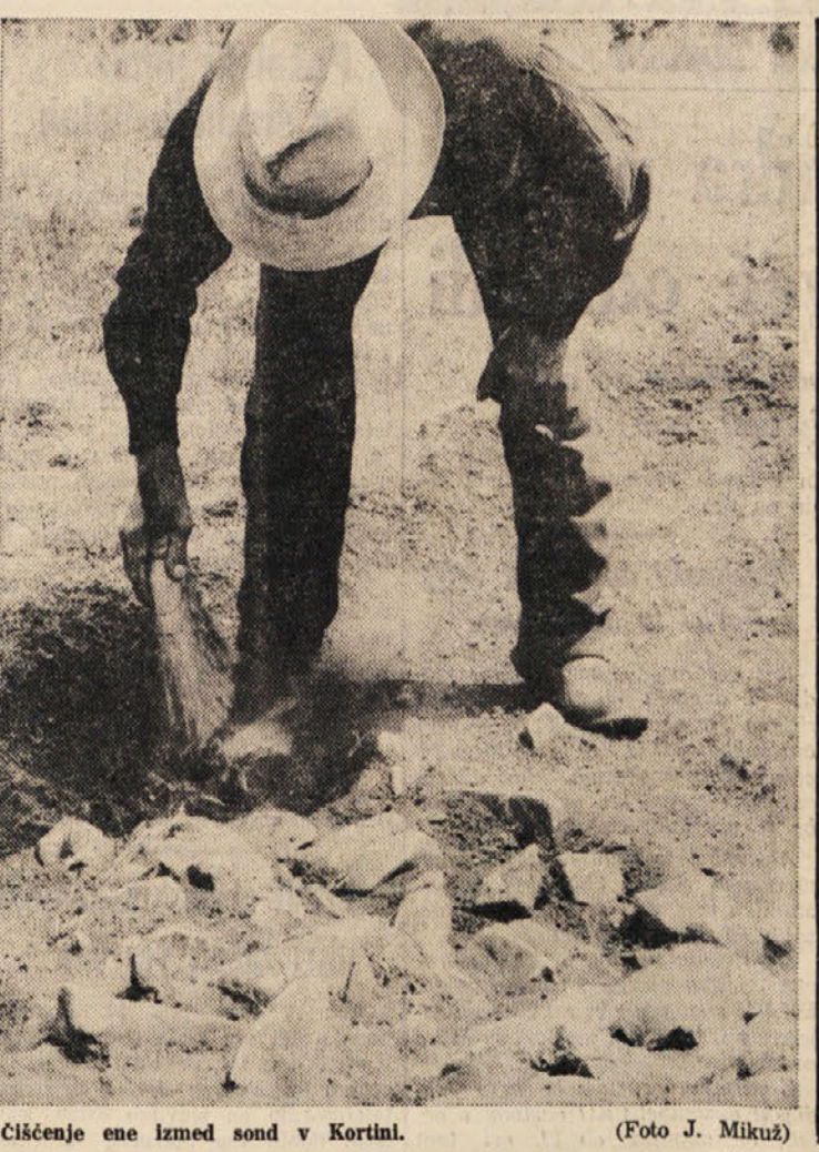
Čiščenje ene izmed sond v Kortini.

Ob koncu pa še eno opozorilo. Če je mogoče, izogibajte se na najbolj prometnih cest. Po avtocesti ne boste v teh dneh intenzivnega prometa poticali hitreje kot po stranskih cestah. Če vam je le mogoče, zavozite na manj prometne žile. Vedno vžvišite na poti pa je tudi prvi pogoj, da človek dobro preživi daljše počitnice ali pa tudi samo en dan oddiha