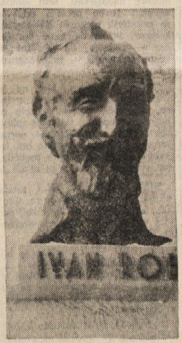
Daprni kip v Šempetru pri Novi Gorici