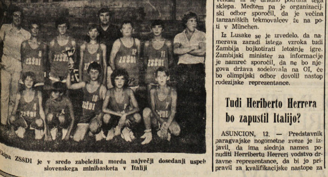
Ekipa ZŠSDI je v sredo zabeležila morda največji dosedanj uspeh slovenskega minibuske v Italiji

Tudi Heriberto Herrera bo zapustil Italijo?