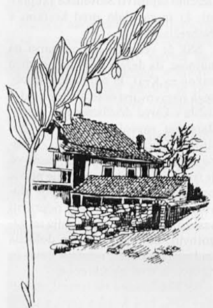
Ilustracija iz Koledarja GMD

Koledar bo ostal trajna dokumentacija našega življenja v zamejstvu in pričevanje o naši dejavnosti za znanost.