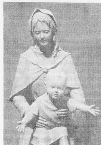
Veselje srečne matere

Darovi so od lanskega leta narasli za 28.277.000 lir. Vsem dobrotnikom naj bo Gospod bogat plačnik!