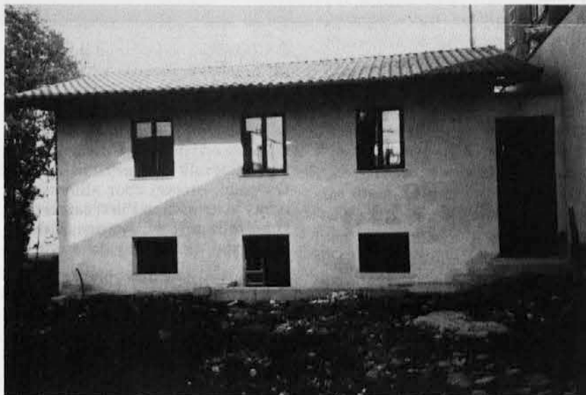
Novi skavtski sedež