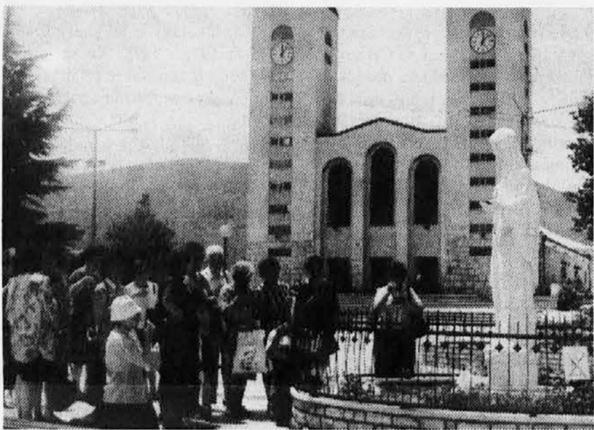
Pred cerkvijo v Medjugorju