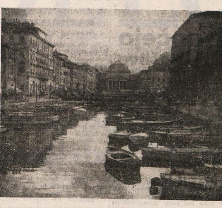
Ze dolgo časa se govori o tem kanalu. Nekateri trdijo, da je kot mostovi, ki so zgrajeni čezeni, dostižni svojemu poslanstvu in da ga je treba zasuti...