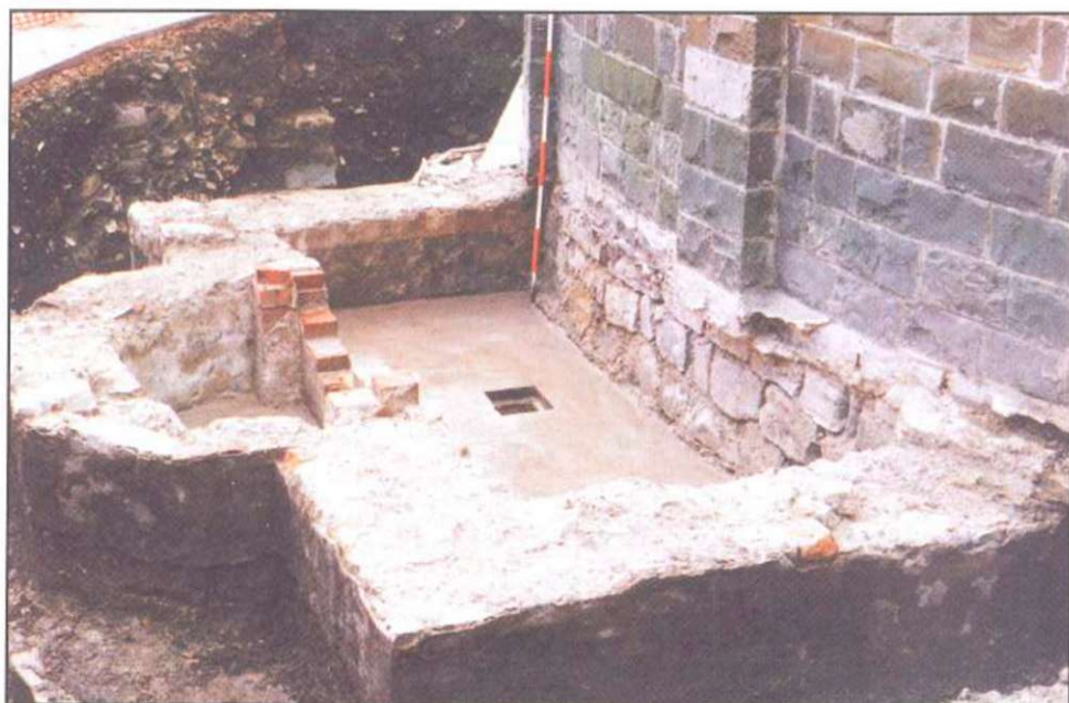
Sl. 3: Baročna prizidana apsida (MZVNKD Piran).