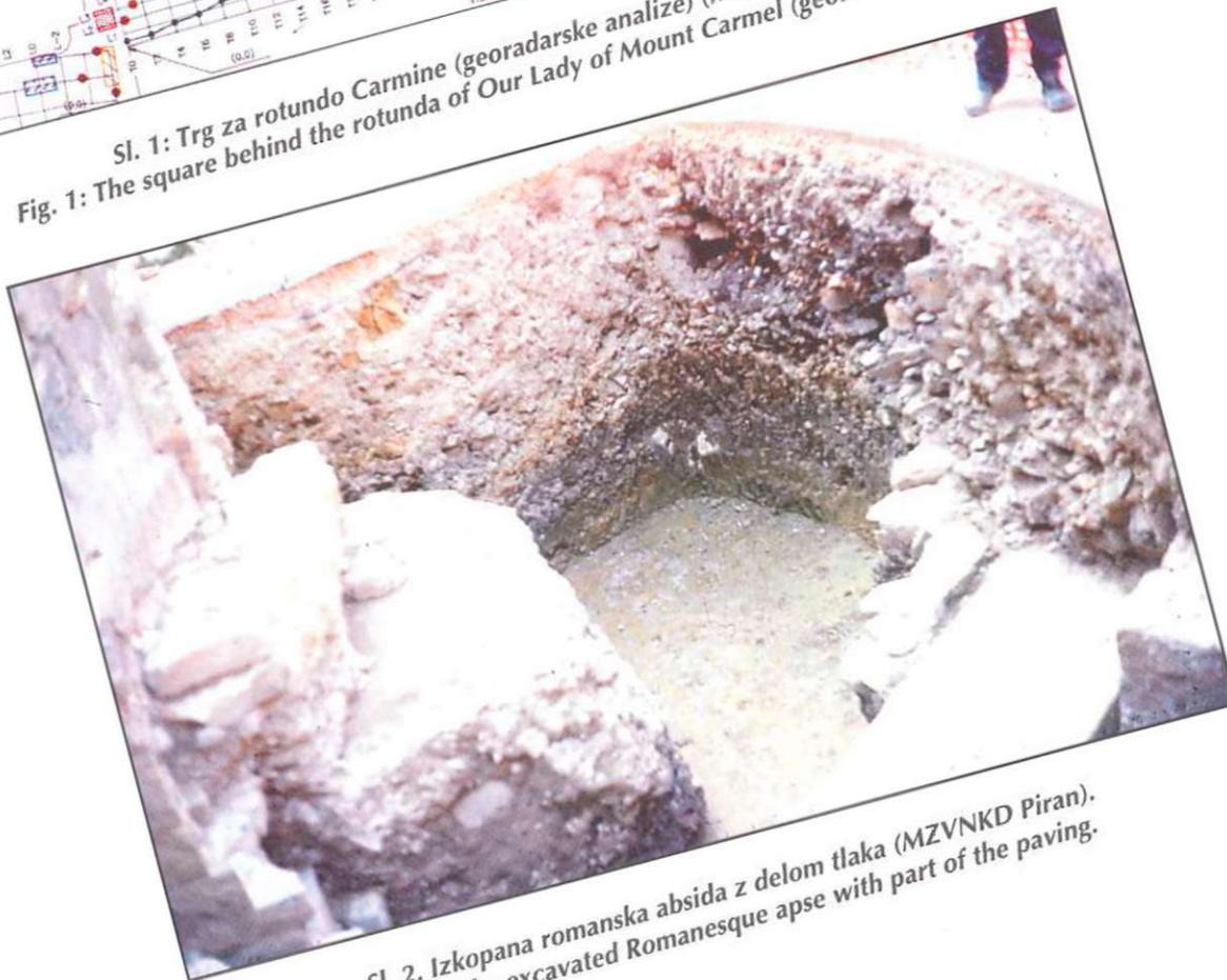
Sl. 2: Izkopana romanska absida z delom tlaka (MZVNKD Piran). Fig. 2: The excavated Romanesque apse with part of the paving.