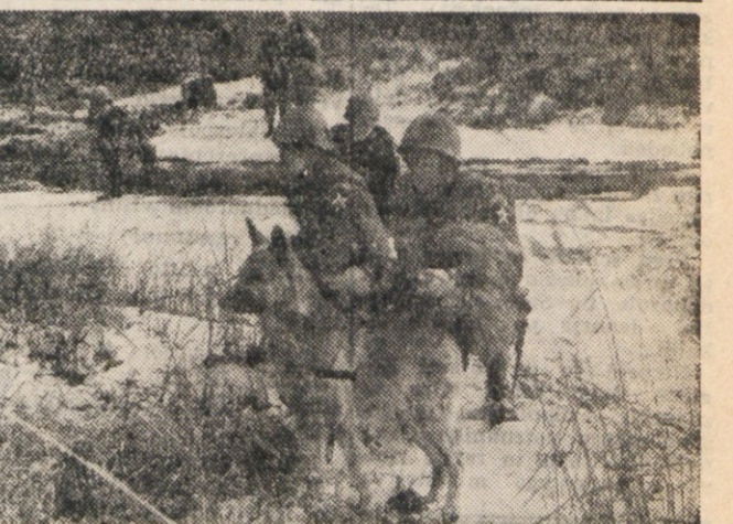
Nemški ovčarji pomagajo straži demarkacijsko črto na Koreji. Celotno število te spajne vojske, katero uporabljajo ameriške sile na Koreji, cenijo na 2.000. Nasprotno splošno prepričanje je, da so njeni vojniki na 2.000. Njemu prepričanje je, da so njeni vojniki na 2.000. Njemu prepričanje je, da so njeni vojniki na 2.000.

Blankov „meščan v uniformi“ ali nevarnosti nemške oborožitve