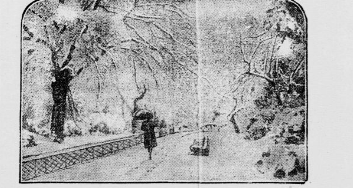
Vihar na Angleškem V južni Angliji je zadnje dni decembra divjal tak vihar, kakor ga že ne pomnijo 50 let. — Na sliki: Zasnežen dreved londonskega Hyde-parka.

»Velik ogenj v newyorškem pristanišču. V Hobokenu, na obeh straneh reke Hudson, je nastal velikanski požar, ki je vpepel celo vrsto ladij in čolnov. Hoboken leži na nasprotni strani Newyorka, ki je poslal takoj, ko je ogenj izbruhnil, na kraj nesreče vse svoje požarne brambe. Vendar niso gasilci mogli ničesar opraviti. Samo eno tovarno ladjo so rešili, vse ostalo so požrili plameni. Škoda, ki jo je požar napravil, se ceni na 3 milijone dolarjev.«