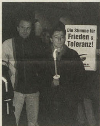
Le šibak celovski glas za mir in strpnost

Tudi koroški škof Egon Kapellari se je v tiskovni izjavi zavzel za izboljšanje splošne družbene klime v Avstriji. »Krščanstvo odklanja vsakr-