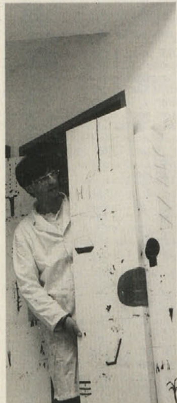
Nič ni abstraktno

»Moj pogled ni tako natančen, kakor si ga marsikdo želi, lahko je pa tudi prenatčen. Jaz lahko samo gledalcu videnje delno