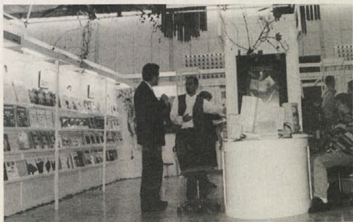
Slovenski knjižni sejem v Cankarjevem domu: Visoko število knjižnih izdaj – nizke naklade

V Ljubljani je bil v času od 24. do 28. novembra petnajsti slovenski knjižni sejem, ki ga je v produkciji Cankarjevega doma pripravilo Združenje založnikov in knjigotržcev Slovenije. Letos se je na sejmu predstavilo štiriinšestdeset razstavljalcev. Veliko besed o knjigah je bilo izrečenih v zvezi z otroki in mladimi, saj se manjše število rojstev že kaže v manjšem številu prodanih otroških knjig. Organizatorji so se odločili za hvalevredno potezo: