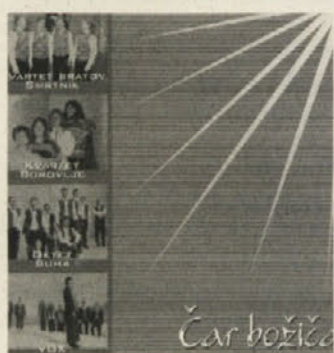
Štirje zbori in »Čar božiča«

Kvartet bratov Smrtnik, Oktet Suha, Vox in Kvartet Borovlje so posneli skupno zgoščenko z naslovom »Čar božiča«, ki vsebuje 16 adventnih in božičnih pesmi. Pretekli konec tedna so zbori svoj izdelek predstavili v živo na koncertih v boroveljski oz. kapelski mestni cerkvi, sledita pa že nastopa v cerkvi v Žvabeku (7. 12., ob 19.00) in Pliberku (11. 12., ob 19.30). Komur so bile pesmi posebno všeč, ali če kdo kljub mirnemu predbožičnemu času ne more na koncerte, bo pesmi