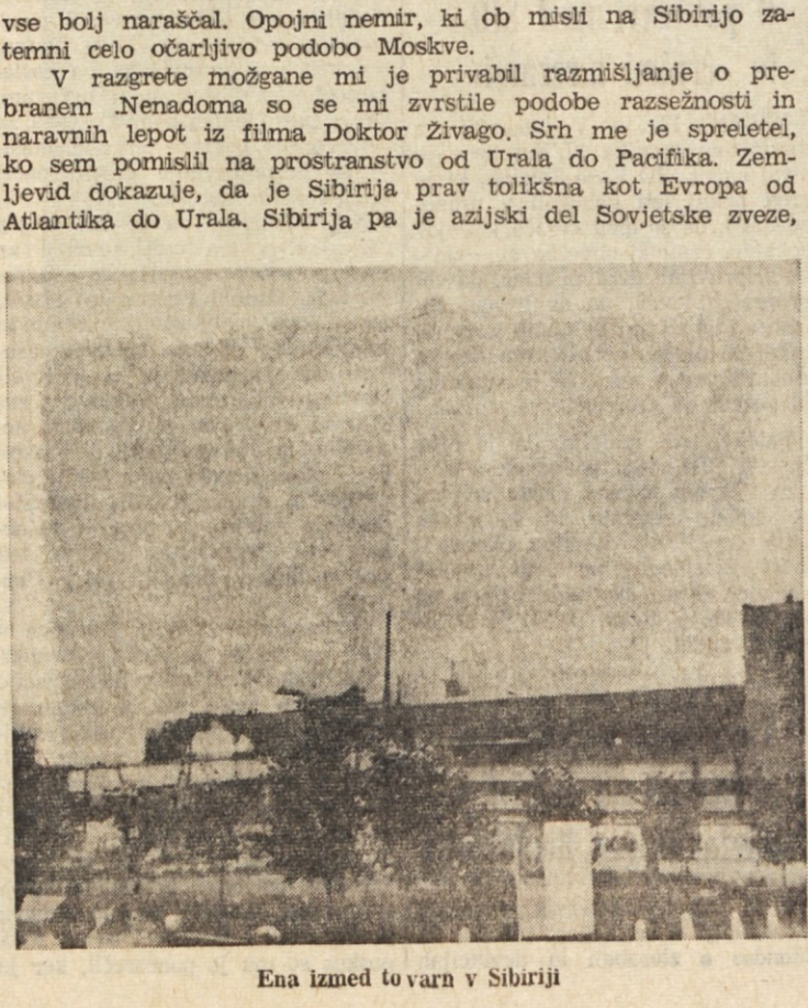
Ena izmed tovarn v Sibiriji

V avtobusu, ki nas je peljal iz mesta na eno izmed štirih velikih moskovskih letališč Domodedovo, sem se pogreznil v misli na nočno Moskvo. Prikical sem si pred oči sprehod kako dobro uro in pol po širnem trgu Kremlja, kjer v mraku nešteto belih snopov luči osvetljuje temnordeče zidove in stolpe.