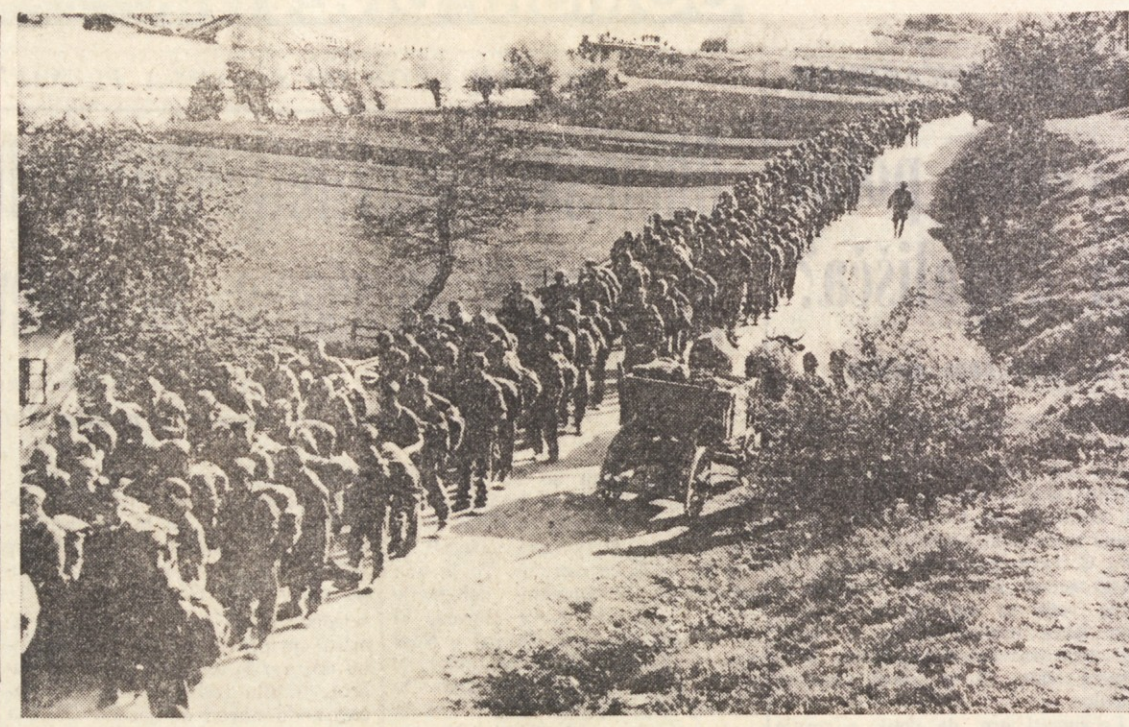
Del V. prekomorske brigade «Ivana Turšiča - Iztoka» v aprilu 1945, ko je pri Vinici prekorčila Kolpo

komorske pa so sovražnika odbili in začeli prodirati proti Starim žagam. 20. aprila je bila brigada v Črnomlju razformirana. Njeni borci, podoficirji in oficirji so bili razporejeni v stare slovenske partizanske brigade in v njihovem sestavu nadaljevali boj vse do dokončne osvoboditve Slovenije. V. brigada je bila sicer časovno malo v boju, toda v tem kratkem času je padlo nad 10 odst. njenega moštva, 256 borcev in oficirjev. Zato ni nič čudnega, da je bila odklikovana z Redom zasluže za narodi z zlato zvezdo.