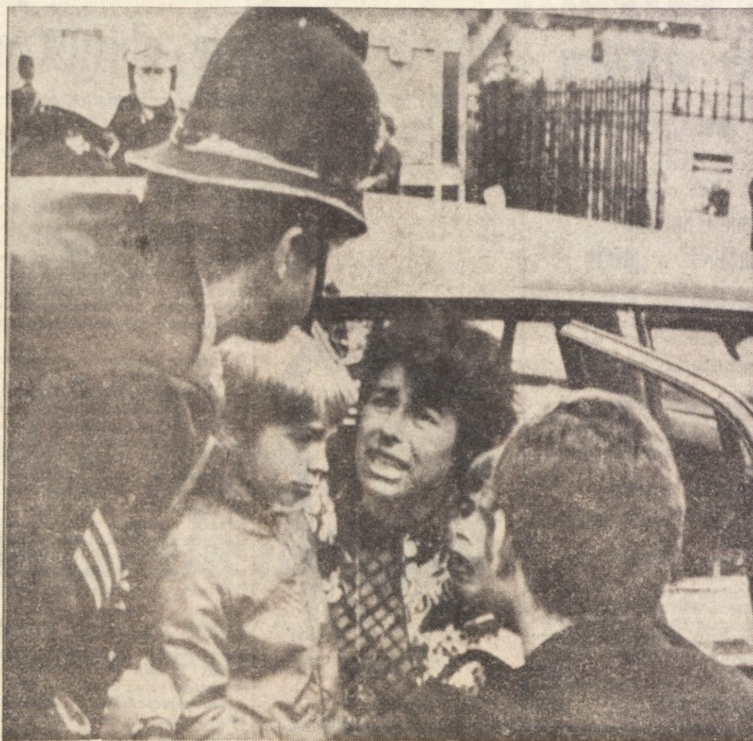
Po eksploziji peklenkega stroja v londonskem stolpu: policista mirita švicarko in njena otroka, ki jih je tresk bombe hudo prestrašil

Nixon pravi, da je pred časom mislil na odstop, v primeru, da bi kongres sklenil začeti priti njemu po postopke za odstavitev. Nato pa se je premislil in odločil, da bo branil svoje predsedniško mesto z vsemi močmi.