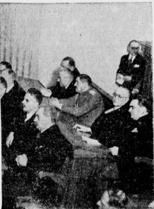
Vlada v narodni skupščini