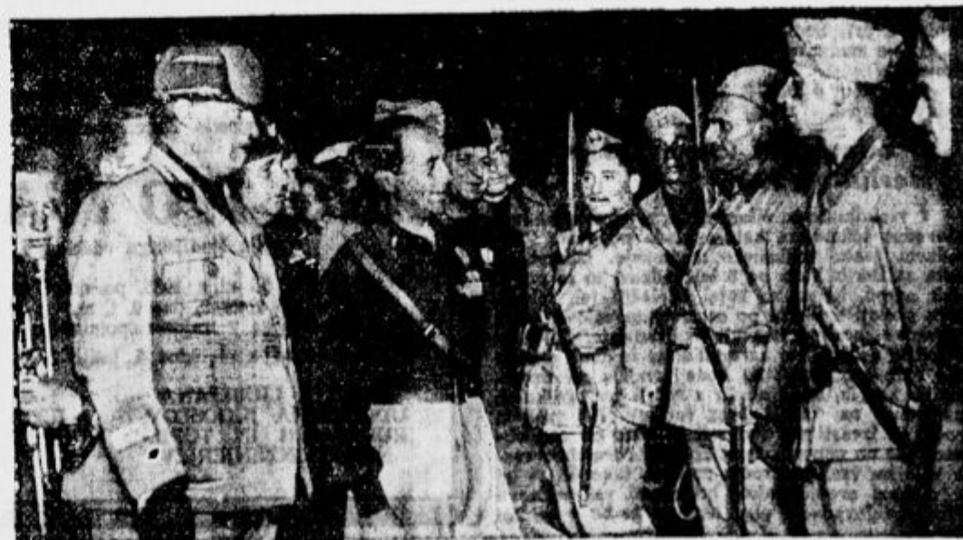
Italijani so sedaj vkrcali za Vzhodno Afriko tudi 215. in 220. bataljon »črnih srajc«. Na naši sliki vidimo generalnega tajnika fašistične stranke Sistraceja, ki pregleduje čete pred odhodom v Afriko