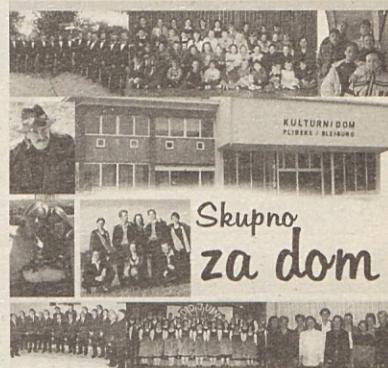
Skupno za dom

CD, katerega izkupiček je namenjen izgradnji Kulturnega doma.