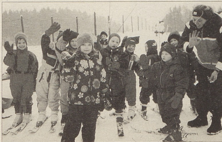
Otroci iz vrta Šentprimož so bili na smučarskem tednu na Peci.