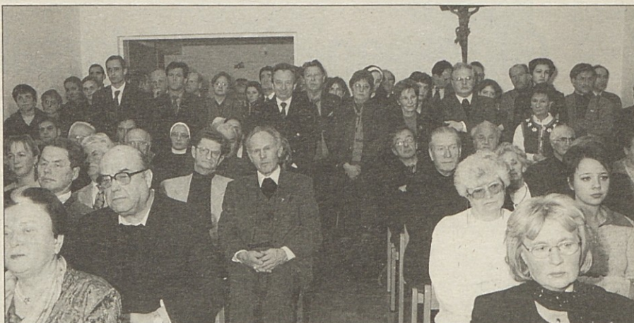
Tischlerjeva dvorana je bila polna do zadnjega kotička.

Od leta 1964 do 1973 je bil namestnik okrajnega glavarja v Velikovcu. Tedanji deželni glavar Sima je konec leta 1973 skušal urediti nekaj podobnega, kakor je to danes Biro za