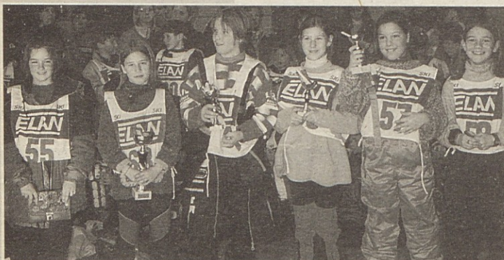
Vsi udeleženci smučarkega tekmovanja LŠ Bilčovš so po tekmi prejeli pokal oz. „sladko“ darilo.

ki bo v soboto, 29. januarja, na progi pri Kezarju v Lepeni. Start bo ob 18. uri, prijave so možne še do 17.30.