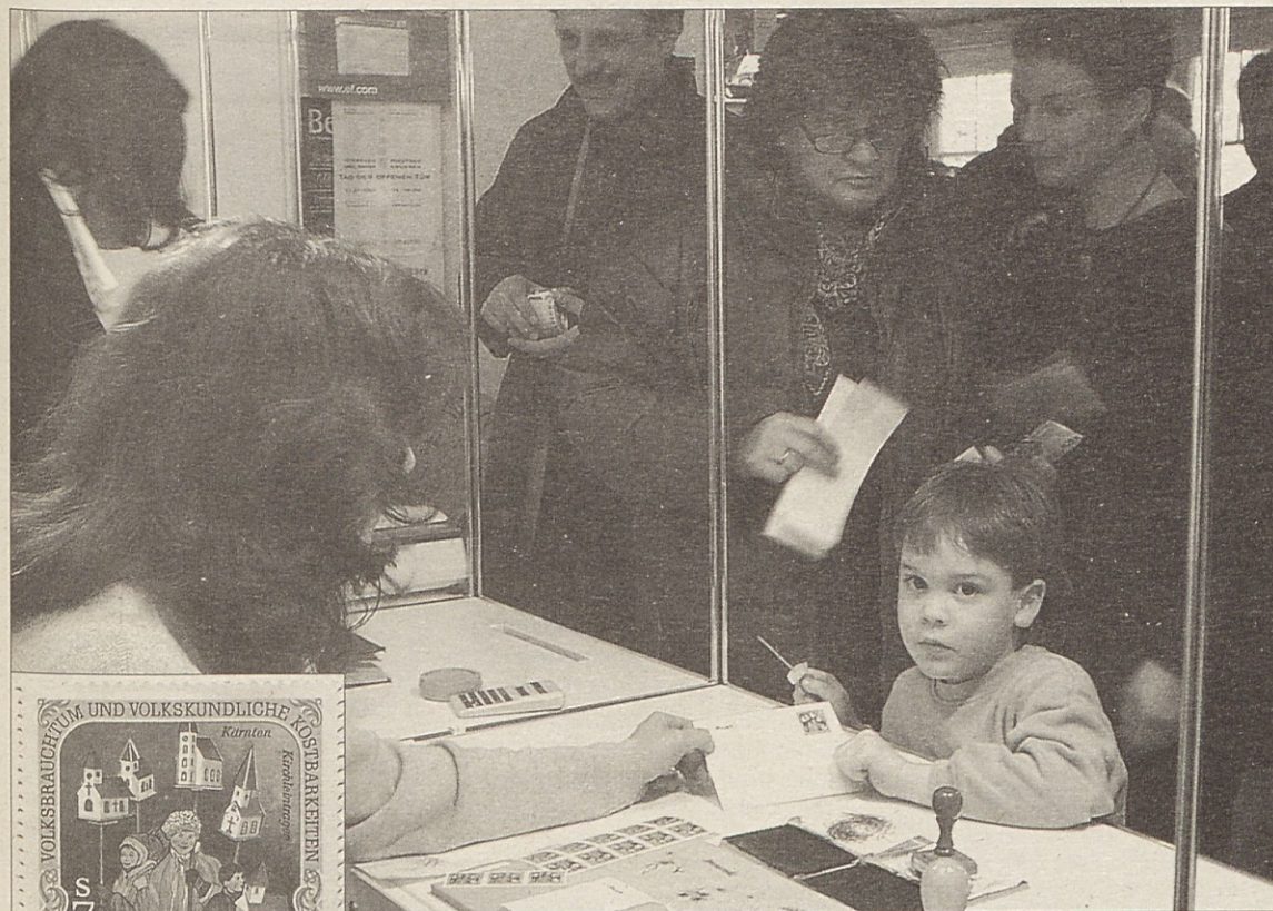
Ob izidu znamke o nošenju cerkvic so v glavni šoli v Železni Kapli uredili posebno poštni urad, kjer si je znamko lahko vsakdo kupil.