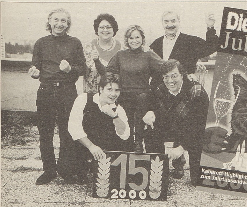
Svoj jubilejni petnajsti program bodo kabaretisti predstavili v soboto v Tinjah.

Kabarett-Highlights zum Jahrtausendwechsel SAMSTAG 5. FEBRUAR 2000 19.30 UHR BILDUNGSCHAUS SODALITAS TAINACH/TINJE Platzreservierungen erbeten Eintritt: S 200,- 9121 Tainach/Tinje Tel. 0 42 39 / 26 42 Fax 0W 76