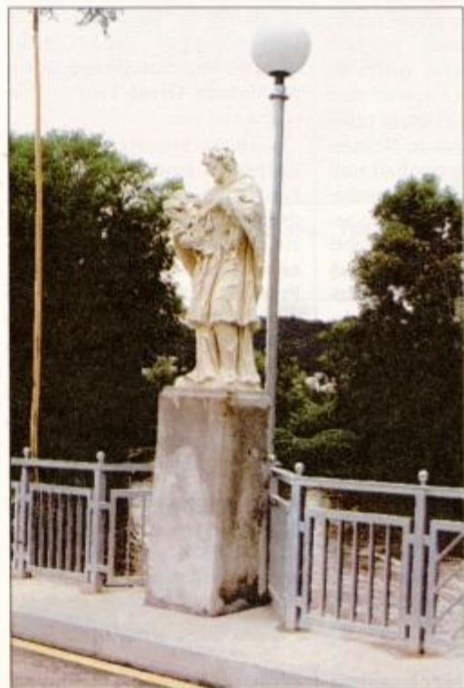
V spomin zavetniku mostov v Majšperku

SEAT IBIZA od 16.990 DEM SEAT CORDOBA od 19.990 DEM SEAT TOLEDO od 26.317 DEM