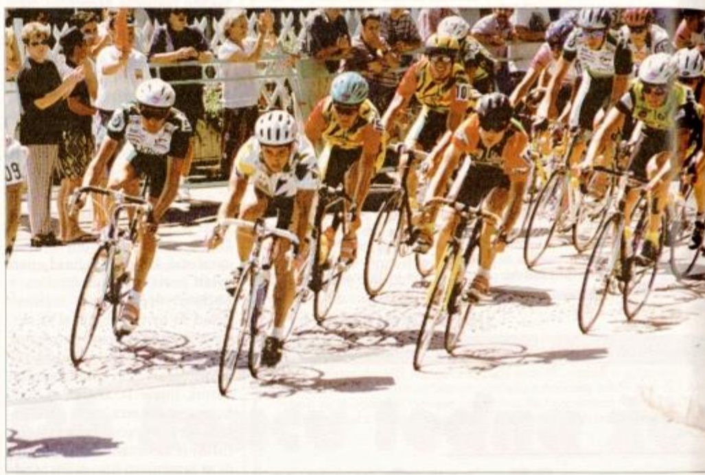
V strnjeni skupini do naslednje taktične poteze.