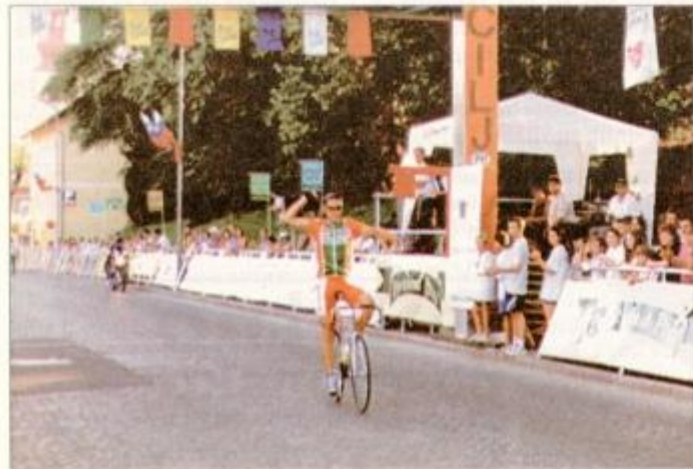
Veseli Sandija Šmerca po izredni zmagi za veliko nagrado Pucha.

Štajerskem. Pri dečkih A za memorial Mitje Plavčaka in pri mlajših mladincih sta zmagala