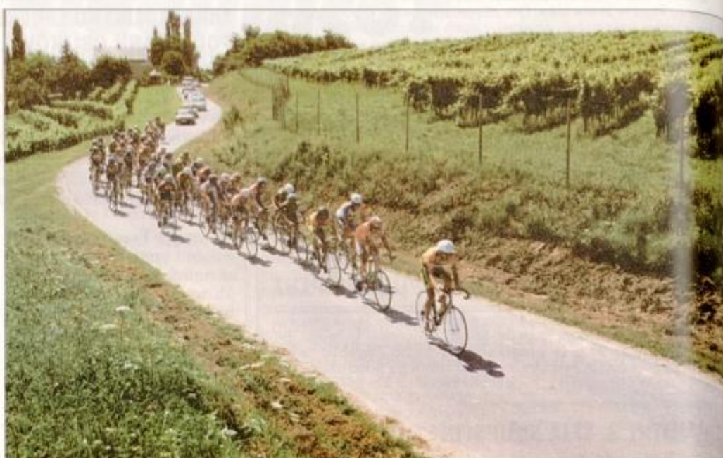
Proga je bila dolga 13,4 kilometra in speljana tudi med vinogradi.