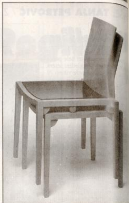
Branko Uršič: Stol Kvadro, 1996