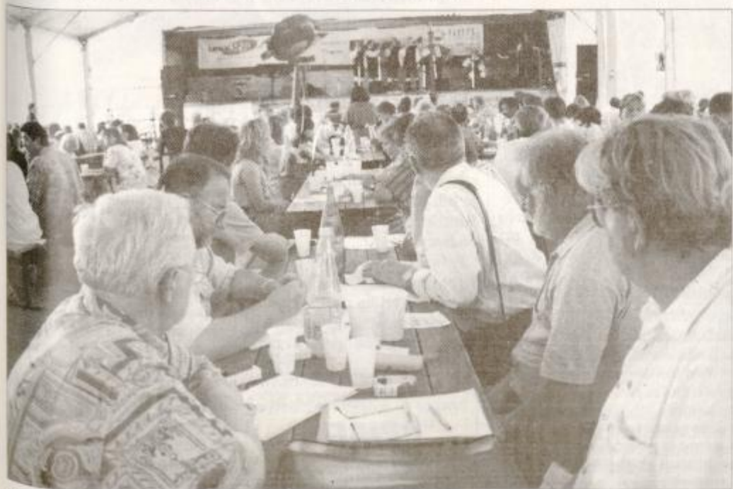
Strokovna žirija je pazljivo spremljala nastopajoče ...