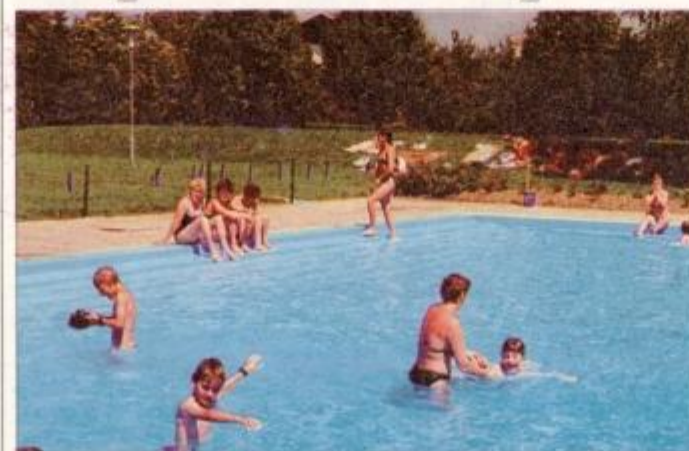
Poletni užitki so se pričeli

Minuli konec tedna so odprli ormoško poletno kopališče, potem ko je občina Ormož, ki je njegov lastnik, s komunalnim podjetjem sklenila pogodbo o vzdrževanju in upravljanju. Prihodno sezono bo ta dejavnost oddana s koncesijo, to poletje pa je kopališče ujelo nepripravljeno, saj razpis za koncesijo še ni končan, kopališče pa je bilo treba odpreti.