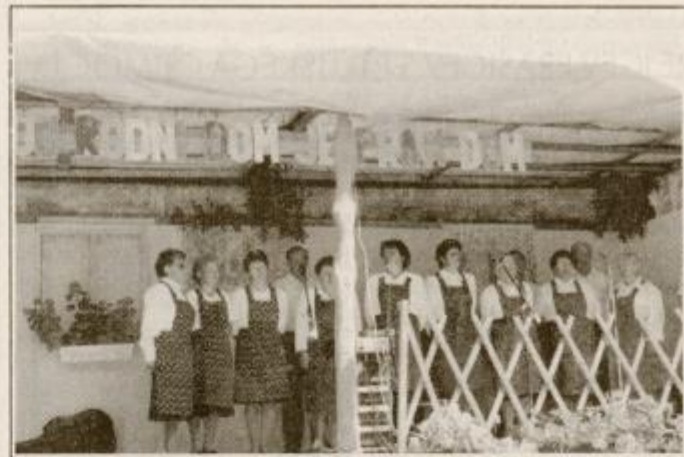
Ljudski pevci in pevke so prepevali o prelepi haloški deželi