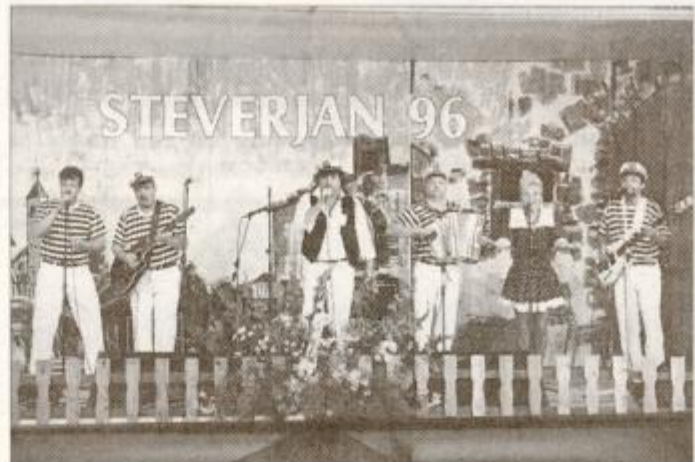
Primorski fantje iz Pirana - zmagovalci strokovne komisije