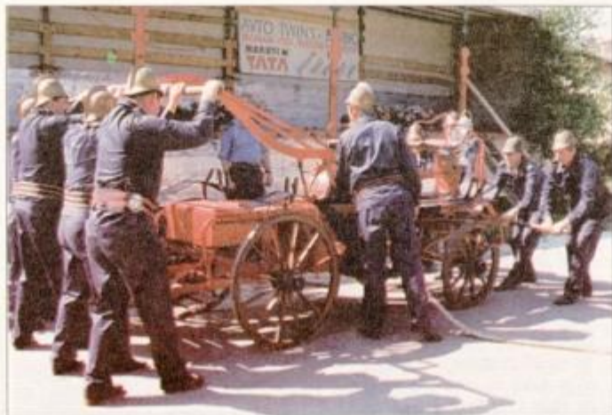
Blizu 100 let stara ročna brizgalna je zahtevala posadko vsaj deset krepkih mož. Po toliko letih je gasilec iz Mihovc - Dragonje vasi z velikimi mukami uspelo, da je iz nje pritekla voda ...

včasih uporabljali pri svojem delu, so gasilci iz štirih okoliških gasilskih društev na njej še sami predstavili, kako so v starih časih gasili. Kot se spodobi, so bili v starih uniformah, da ne go-