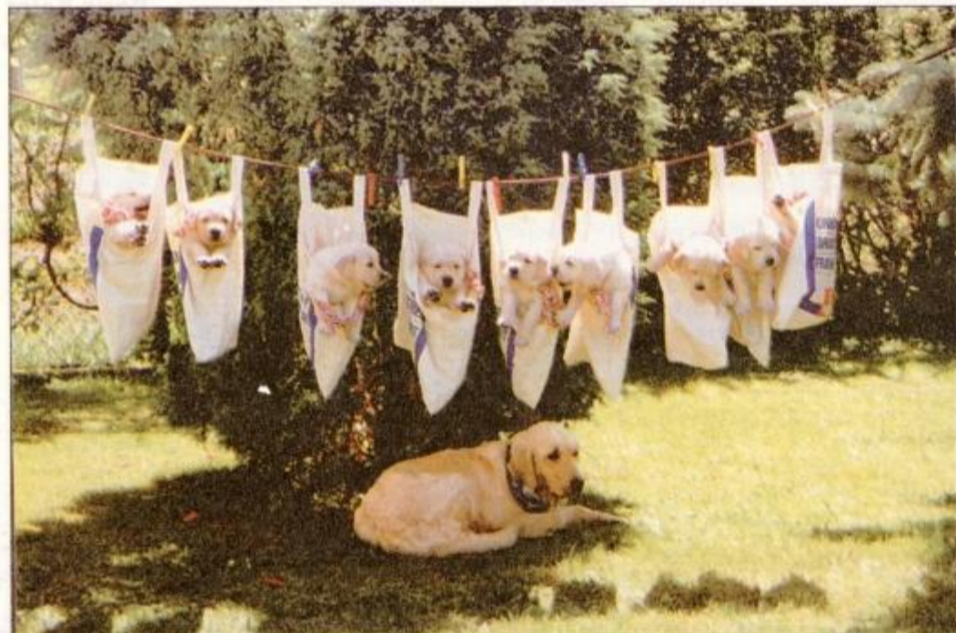
Desetčlanska pasja družina Hojkerjevih med počitkom. Le na tak način je možno obvarovati psičko pred pretiranim sesanjem mladičev.

GORNJA RADGONA / OCENJEVANJE MESNIH IZDELKOV