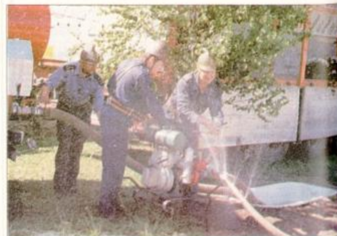
... In potem je škropilo na vse strani ...