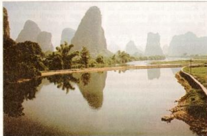
Reka Li z odsevi bambusovih dreves in zelenih apnenčastih vrhov

Smeh je zamrl, ko je med vožnjo zvečer priletel v okno našega kupeja velik kamen od zunaj, da so drobci stekla leteli vsepovsod. Na srečo me takrat ni bilo v bližini. Tudi drugim ni bilo huđega. Reuterju tako ni bilo potrebno poročati o poško-