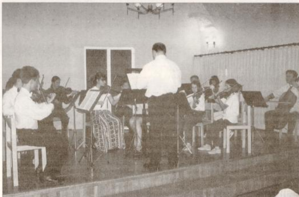
Utrinek s koncerta ob koncu 3. poletne violinske šole.