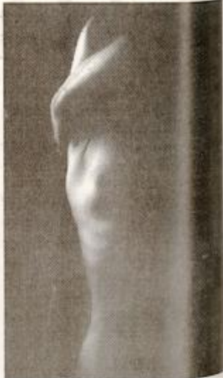
Ena od razstavljenih fotografij S. Zebca

Razstava aktov je Zebčeva prva samostojna razstava. Gre za serijo črno-belih fotografij, ki