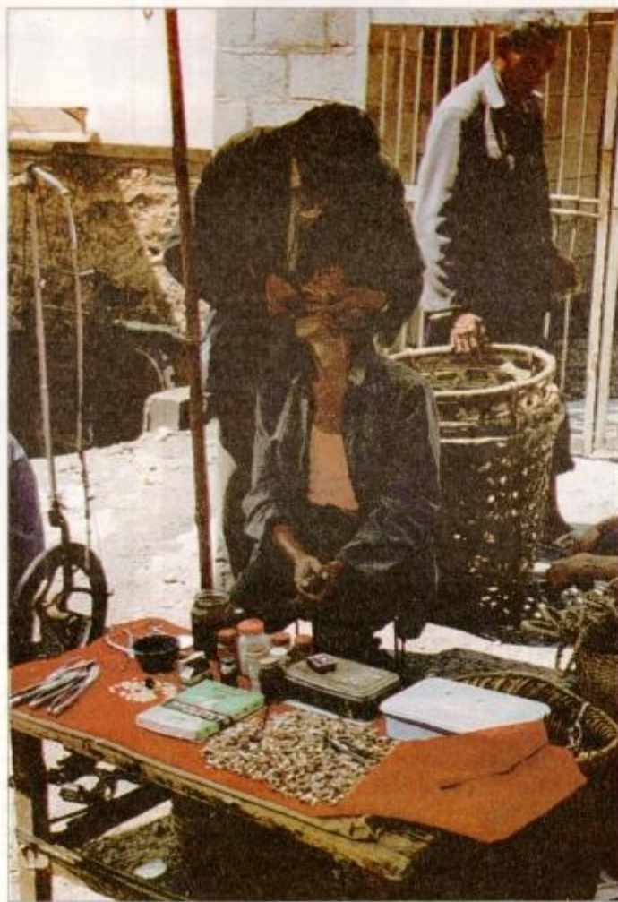
Zobozdravstvena ambulanta na vaški tržnici.

Na vlaku do Guilina smo preživeli rekordnih 33 ur in pol, ki so nam minevale hitreje zaradi sosedov Kitajcev. Žilica za komunikacijo jim ni dala miru in njihovi prsti so pogosto listali po slovarčku, s pomočjo katerega smo se sporazumevali. Prijetni ljudje, ki so neprenehoma jedli, se smejali in kartali.