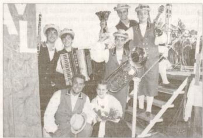
Zamejski kvintet s Krasa je zmagal pri občinstvu.

PTUJ / RAZSTAVA 110 LET TURISTIČNEGA DRUŠTVA