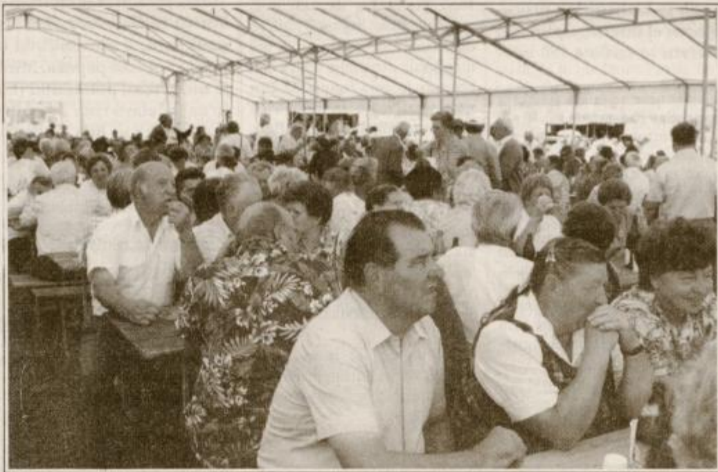
Ker je sonce neusmiljeno pripekalo, je bilo v senci velikega šotora še posebej živahno.

jenje, kot ga ima večji del slovenskih upokojencev.