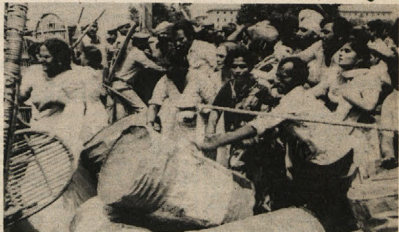
V New Delhiju je prišlo do hudih neredov, ko je več tisoč ljudi skušalo protestirati pred uradom predsednice vlade Gandhijeve zaradi umora nekaterih političnih voditeljev v zvezni državi Pundžab. V neredih je bilo nad sto ljudi ranjenih.