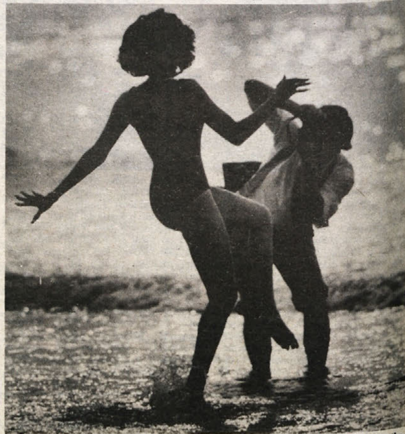
V ameriškem Atlantic Cityju izbirajo te dni najlepšo Američanko in marsikatera lepota pozira na plaži pred objektivom fotoreporterjev