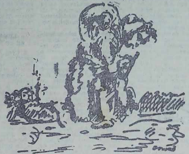
CIGANKA IZ PUŠČE

MESTNI KINO V MURSKI SOBOTI predvaja od 19. do 22. januarja angleški film »Zapeljivka iz Novega Orleansa« od 23. do 25. januarja sovjetski film »Vlak pelje na vzhod« in od 26. do 29. januarja ameriški film »Zmajevost« I. del.