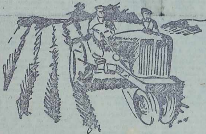
Z globokim zimskim oranjem dvignemo hektarske donose

Sončni zimski dnevi so ustregli zadružnikom in kmetom. Povsod — kamor stopiš — jih je videti na polju. Orjejo nove brazde, v katere bodo spomladaj sejali. Mnogi se zavedajo koristi globokega oranja, zlasti še sedaj