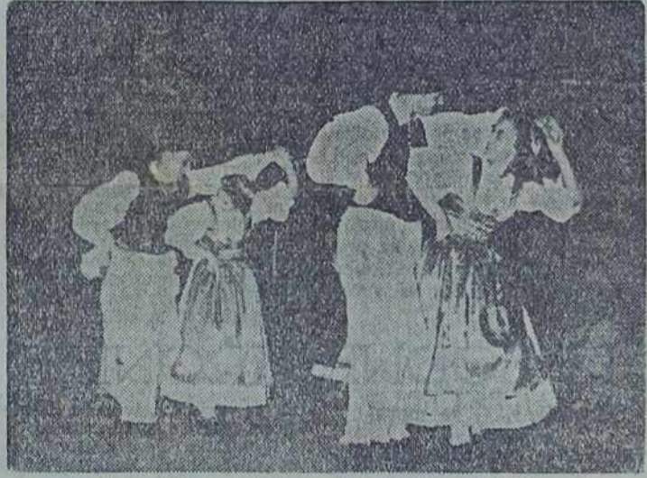
Beltinska folklorna družina pri izvajanju narodnih plesov

Izvršni odbor Ljudske prosvete Slovenije je povabil folklorno skupino iz Beltincev na tekmovanje v Ljubljano. Manjkajo jim samo obleke. Tudi tukaj so končno našli izhod. Na skupščini