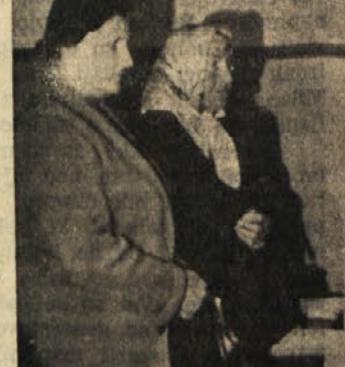
V nedeljo zvečer je volilo 94,72 odstotka volivnih upravičencev. Preostali, ki so bili v nedeljo na izletu ali na delu, pa so volili večeraj zjutraj.