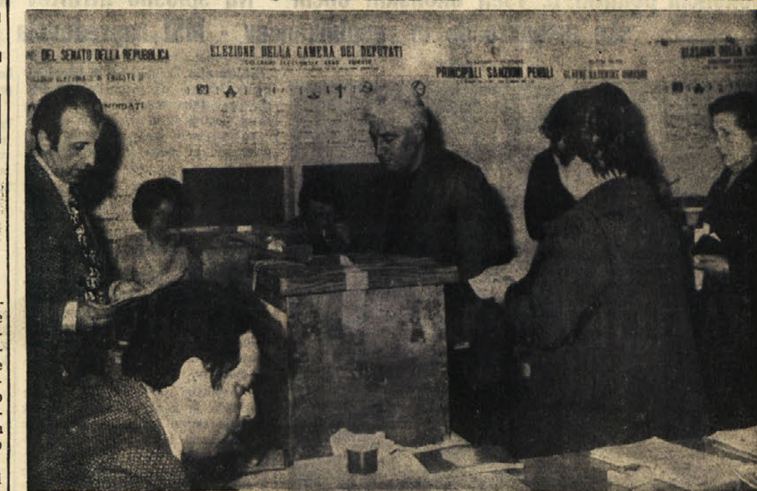
Parlamentarne volitve na Tržaškem so potekale v najlepšem redu. Udeležba je bila zelo visoka in je presegla udeležbo iz leta 1968. Na sliki: prizor z volišča v Nabržini

Volitev se je udeležilo 93,1 odstotka volilnih upravičencev - Okrepitev socialistov na račun PSIUP - Dokaj omejen porast neofašističnih glasov