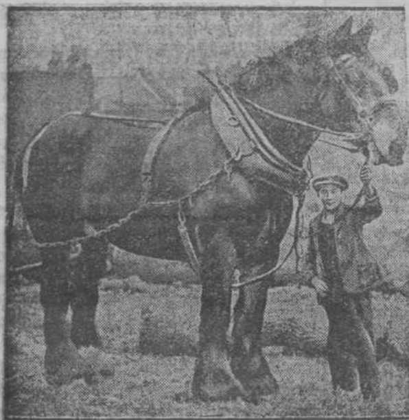
Čudo za naše kmetovalce: