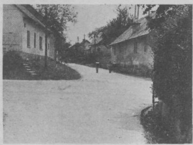
Tudi ta prometni znak »Stop« v Zadvoru je zakrit, kar predstavlja nenehno nevarnost za voznike motornih vozil