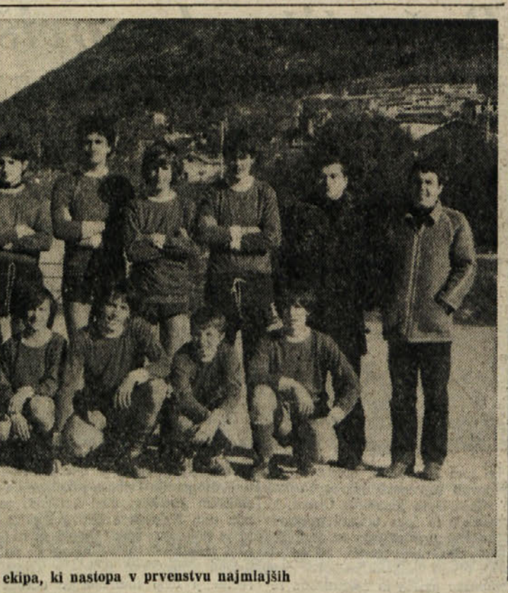
Bregova ekipa, ki nastopa v prvenstvu najmlajših