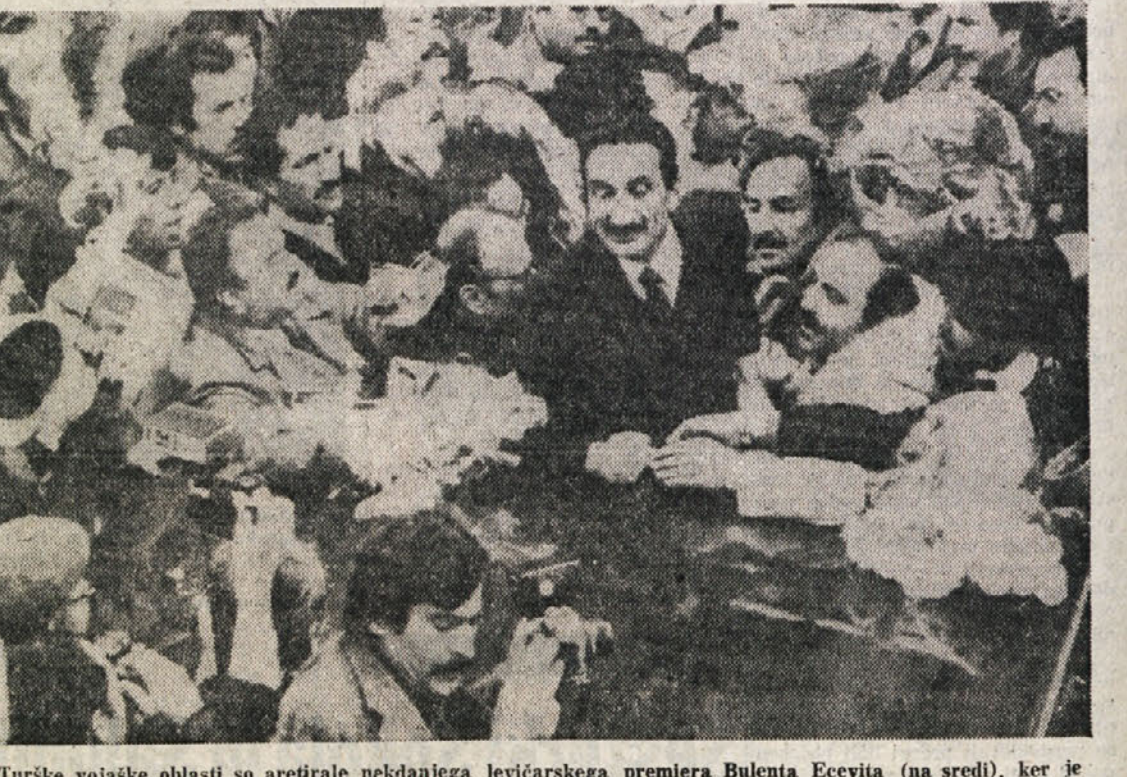
Turške vojaške oblasti so aretirale nekdanjega levčarskega premiera Bulenta Ecevitia (na sredi), ker je prekršil začasni vojski zakon, ki prepoveduje politične izjave.