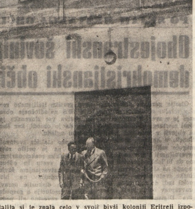
Italija si je znala celo v svojih bivši koloniji Eritreji izposlovati svoj dom, ki ga vidimo na sliki. Eritreja je danes sestavni del Etiopije, kjer je fašistična Italija uporabljala celo strupene pline poleg drugih sredstev civilizacij. Prav bi bilo, da bi danasnja Italija mislila malo več na naše domove v Trstu, ki so jih fašisti požgali in oropali.