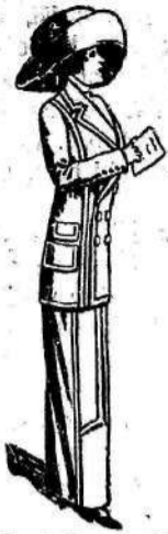
Medne knjige za obleke 100—150 lepih slik zastoj.

Na novo je došlo velike množine lepega volnenega blaga v novomodnih pastel barvah za pomladanske in poletne obleke. Kakor tudi krasni vzorci v perilnem blagu, kambriku, satenu, foularju, panama i. t. d.