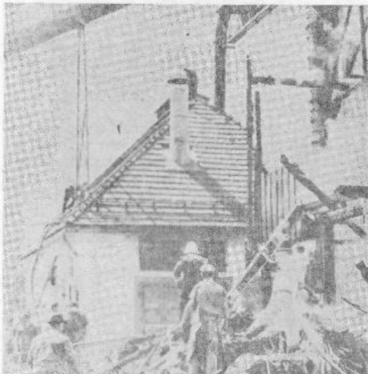
Organizirana akcija reševanja

— Samoupravna stanovanjska skupnost zagotavlja finančna sredstva za kolektivno zaščito in reševalno opremo v stanovanjskih stavbah, katere upravlja.