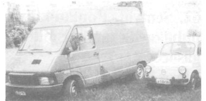
Očitno si nekateri lastniki železnih konjičkov na Tugomerjevi ulici, namen zelenic drugače razlagajo kot večina ostalih prebivalcev. Kot je znano, se njihovi konjički ne hranijo s travo, ampak z bencinom. Pred stanovanjskim blokom številka 20 so te površine že davno spremenili v parkirišča. Morda bi ne bilo napak, če bi jim hišni svet postal račun za parkiranje.