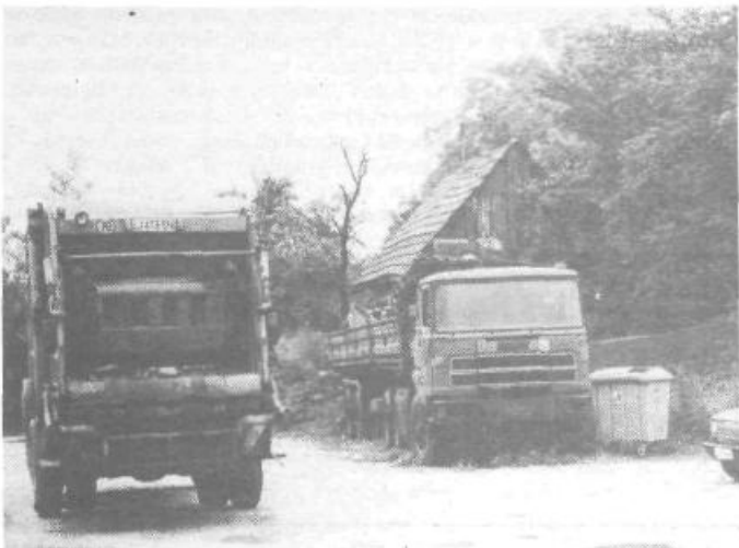
Levo na posnetku je kamion mestne snage, v sredini pa „prikoličar“, ki je v Mednem parkiran že tako dolgo, da ga je zarasla letošnja trava. Ker je parkirani kamion večji kot kamion snage, je torej fizično popolnoma nemogoče, da bi ga odstranili komunalci. Le kdo ga bo?