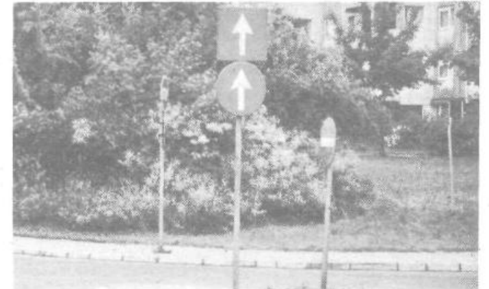
Tale „grozd“ prometnih znakov pomeni, da vozniki ne smejo zavijati v desno (na dovoz avtoceste v Dravljah). Ker si vozniki ta sopek različno tolmačijo, prihaja v tem križišču do silovitih zapletov. „Ujeji“ smo trenutke, ko so po enem izmed zapletov iz križišča odstranili posledice „konflikta“ . . .