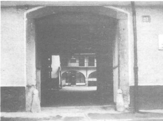
Še nedavno tega, je bila med tem vrati pod halo Tivoli strašanska gneča. Drenjali so se novinarji: Delavske enotnosti, Naše žene, Našega delavca, Vzajemnosti, Novosti, Borbe . . . Drenjali in zavijali v bife za vrati. Usodo Delavske enotnosti, ki je imela z drugimi časopisi tamkaj sedež, so zapečatili vrli „gospodarji“ in kar je za novinarje najbolj tragično: zapečatili so tudi bife!