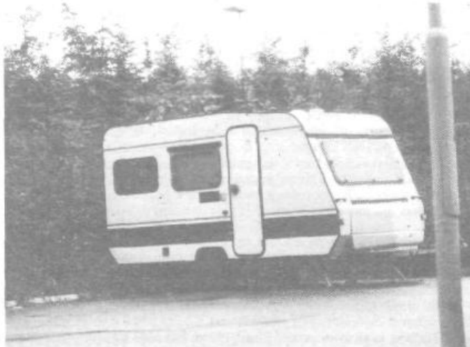
Javna tribuna je nenehno v finančnih Skripcih, zato menimo, da bi lahko novo-meški IMV vsaj nekaj prispeval za reklamiranje njihovih prikolic, ki jih objavljamo v skoraj vsaki številki. Tote smo slikali (lahko pa bi jih še ducali), v KS Komandanta Staneta . . . Kdo pravi, da nimamo dovolj parkirišč!?