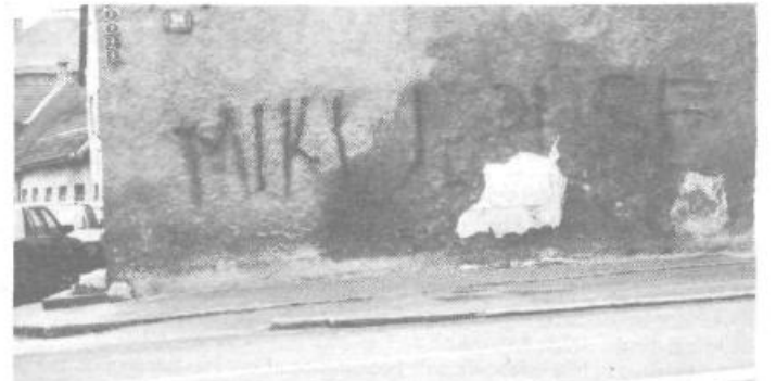
„Dejte no, dejte“ . . . Saj se sam ne more.