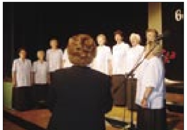
V programi so gorastaupile varaške ljudske pevke tö

pesmimi pozdravljale svoje vrstnike, Oče so mi küjčili, Fanti se zbejrajo, Dober večer mamica, Igrala je igrala. Ženske so si zaslužile velki aplauz, mele so fejs dobro vöodabrane porabske nate, z veselim pa bola smejšnim besedilom, s karažno, pestro melodijo, stere so iz srca zaspejvale. Leko smo čütili, ka je spejvanje najvejšo veseldje za-