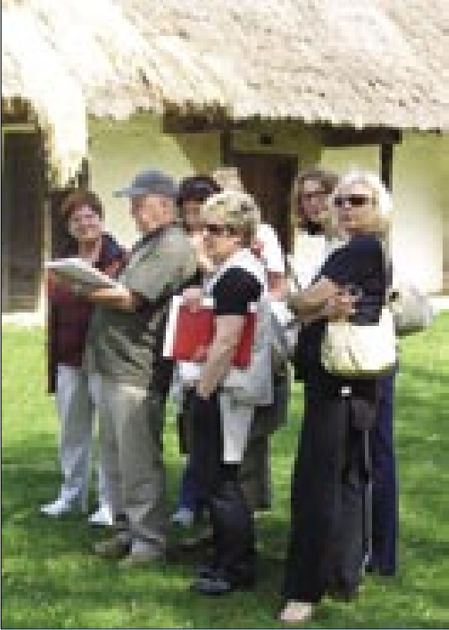
Mentor in členice društva

aprila pa so prišli členu likovnega društva Mavrica (peterlaug) iz Novoga mesta za dva dni kejp redti. Njino društvo je že deset lejt staro. Na začetki so bili pauleg samo upokojenci, kesnej pa so gratali členu takši lidge tó, šteri eške v službe odijo, pa samo v slobaudnom cajti malajo.