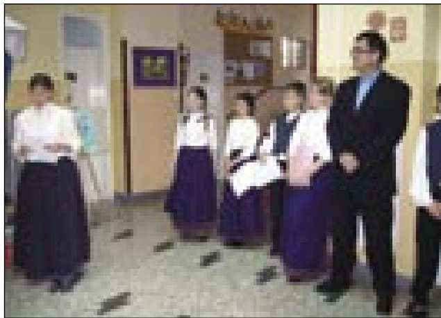
Tako so nas sprejeli učenci in ravnatelj na šoli v Miklavžu pri Ormožu

Folklorna skupina ZS iz OŠ Števanovci je bila povabljen v Ormož na prireditiv. Napotili smo se 14. aprila ob desetih. Bilo je zelo lepo vreme. Na avtobusu smo se veliko pogovarjali, poslušali glasbo, zato je čas hitro minil in ob dvanajstih smo že prispeli v Ormož pred osnovno šolo. Tu so nas pristrčno sprejeli in so nam pokazali šolo. Nam je bila najbolj všeč računalniška učilnica. Potem smo sedli za mizo in smo dobili dobro kosilo. V Ormožu smo si ogledali grad, kjer je bila razstava. Potem smo se z avtobusom odpeljali v Jeruzalem. Ob petih smo se vrnili v šolo, kjer smo igrali s slovenskimi prijatelji nogomet. Nastop se je za-