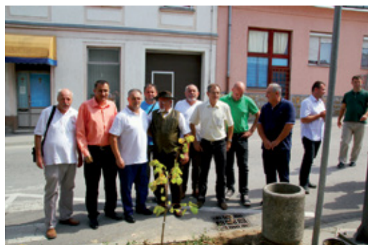
Skupaj s čebelarji Združenja Lipa, turistično organizacijo in Centrom za lokalni in regionalni razvoj iz Dervente smo kot simbol odličnega sodelovanja s ČD Črnomelj v središču mesta posadili lipo – drevo prijateljstva.

Preostali čas smo porabili za ogled turističnih znamenitosti in čebelarstev v okolici Dervente in Bosanskega Broda. Med osrednjimi dogodki obiska je bila brez dvoma skupna zasaditev drevesa prijateljstva – lipe, ki smo jo pripeljali iz Slovenije, v bližini osrednjega trga v Derventi. Med obiskom smo poleg spoznavanja lokalne kulinarike obiskali tudi kulturnozgodovinski kompleks Detlak, izletniško točko Nadeša, družinsko kmetijo »Žikin ranč« in druge zna-