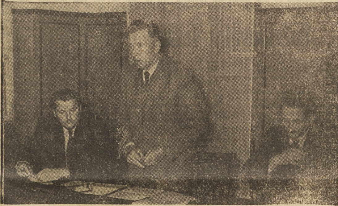
Tovariš Miha Marinko, sekretar Izvršnega komiteja CK ZKS in predsednik Socialistične zveze delovnega ljudstva Slovenije je govoril na posvetovanju sindikalnih odborikov o bodočem razvoju gospodarstva

Iz govora in razprav na posvetovanju sindikalnih odborikov lahko razberemo tele temeljne ugotovitve: