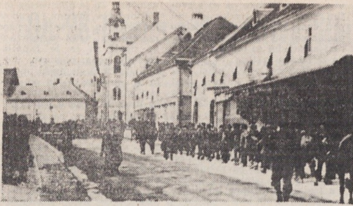
Slandrovci v osvobojenem Novem mestu septembra 1943