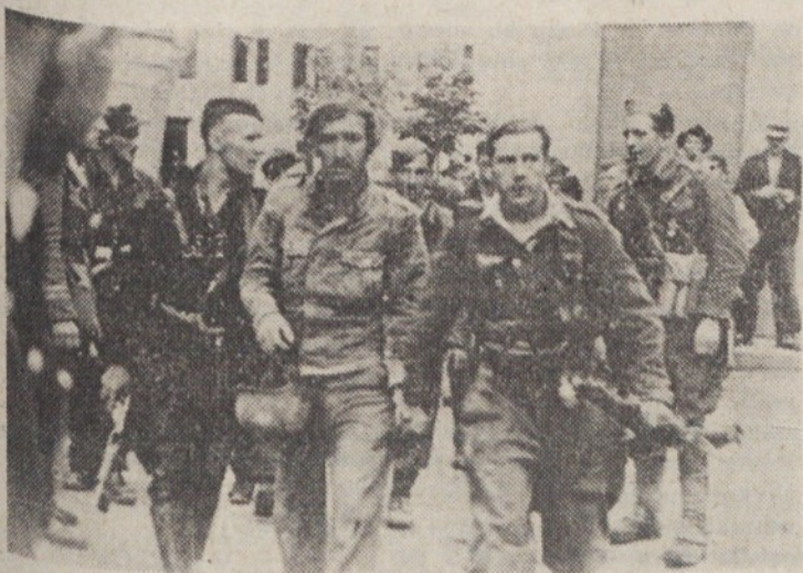
Po veliki zmagi v Ljubnem 1. avgusta 1944. Partizani vodijo ujetega Nemca

Platinova skupina je ostala tam in se krčevito upirala nemški diviziji. Divji ropot se je na-