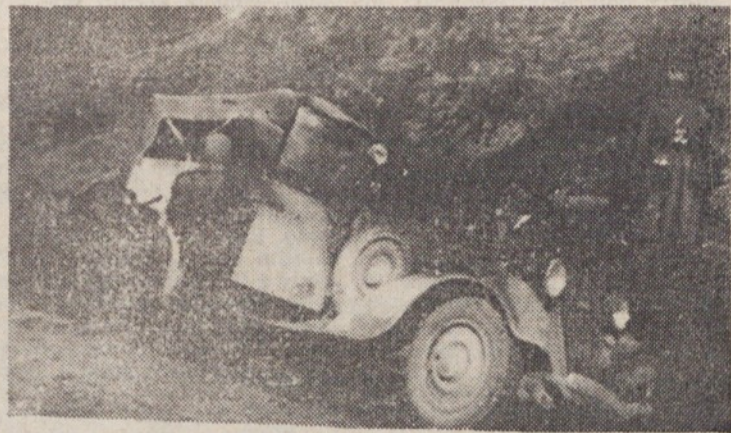
Uspešen napad Slandrovcev na nemški avtomobil februarja 1944

Prvi smo se že bližali progi, ko je naenkrat zadonel zloslutni »HALT!« Prav takrat so zadnji borci zapuščali obrežje Save, razspredaj pa se nismo ozirali r