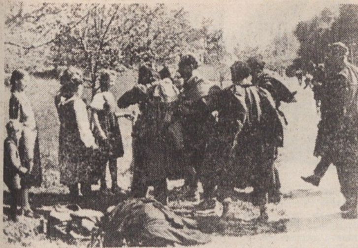
Domačini na Moravškem pozdravljajo Slandrovce

Predhodnica je izvedla izredno hiter juriš in dosegla cesto pri Mlinšah. Sem in tja so padale bombe, naše in sovražnikove, ki so grozeče parale nočno nebo.