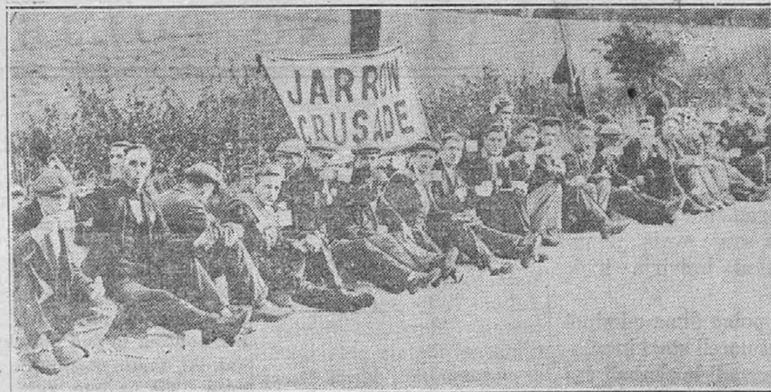
Več tisoč brezposelnih iz raznih krajev Anglije je napravilo zadnje dni pohod proti Londonu, da vložijo v parlamentu zahtevo za pomoč. Gornja slika kaže skupino teh "gladovnikov".

ONIM, ki plačujejo račune za plin in elektriko v uradu "Amer. Slovenca" javljamo, da je urad podružnice American Express Co. v našem uradu odprt od pol 9. ure zjutraj do 5. ure popoldne vsak dan razun sobote. Ob sobotah samo do pol 1. ure popoldne. Po novem določilu morajo biti vsi računi za plin in elektriko plačani in odposlani naprej najkasneje tisti dan, ki je določen za popust. Zato vsaki dan zaključimo sprejemanje plačil za te račune ob 5. uri popoldne in jih nato odpošljemo naprej. Po 5. uri popoldan ne sprejemamo plačil za plin in elektriko. Prosimo, da vzamejo vsi to na znanje.