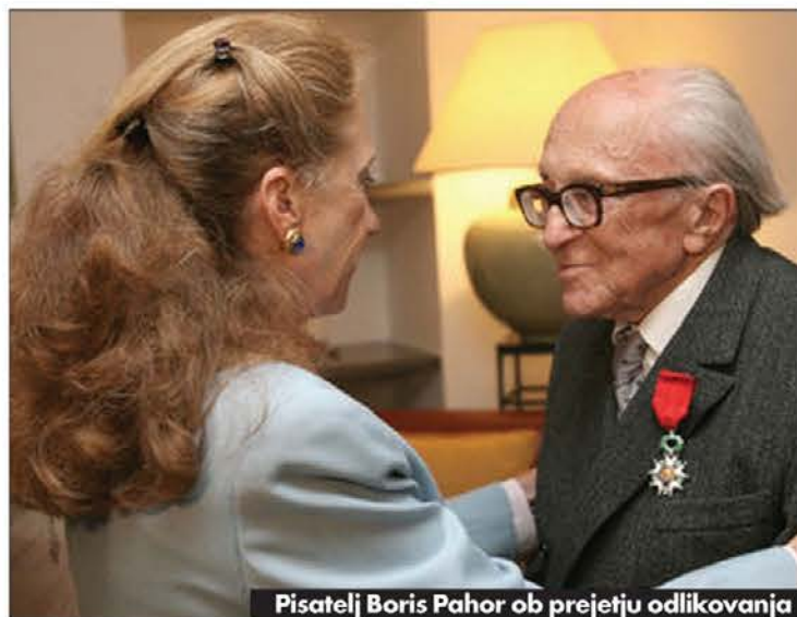
Pisatelj Boris Pahor ob prejetju odlikovanja