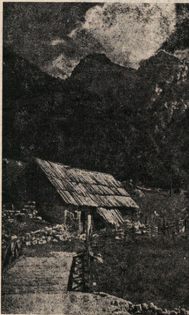
Motiv iz Trente