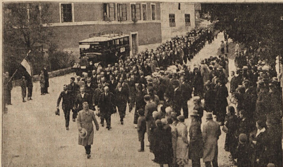
Defile zadnjega bataljona bojnikov — 284 četverstopov.