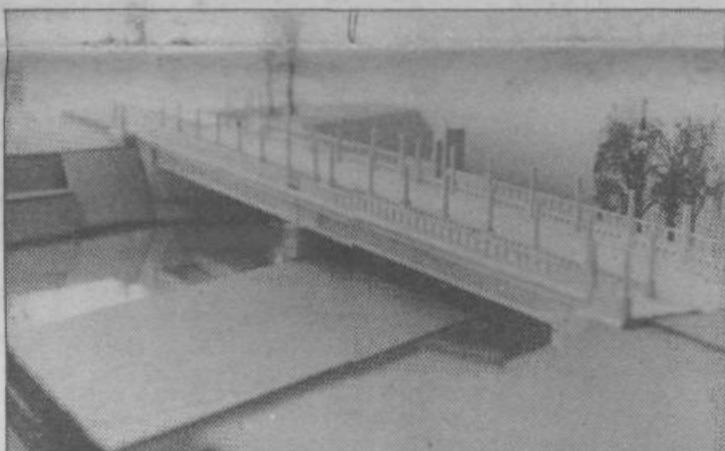
Takšen bo novi fužinski most