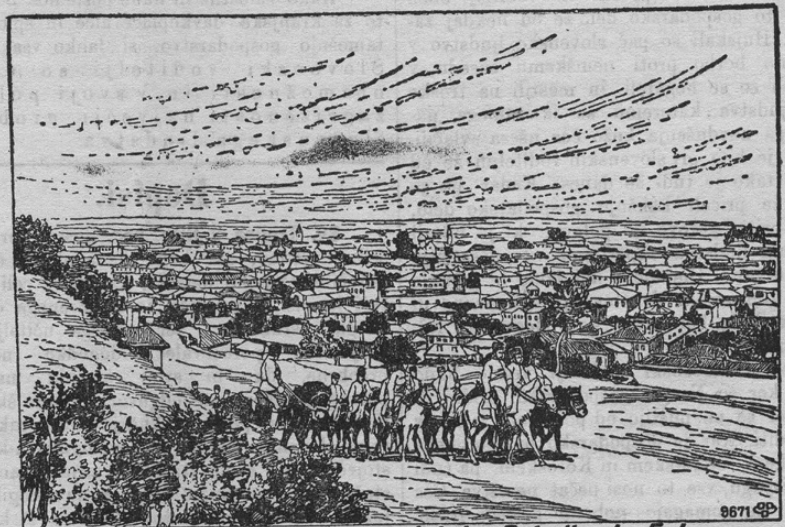
Ansicht von Koritza, dem Hauptziel der Rebellen im Epirus.

Na Balkanu še vedno ni miru. V južni Albaniji bijejo se namreč hudi boji z grškimi ustaši, katere podpirajo baje tudi regularni grški vojaki, čeprav to vlada v Atenah taji. Ustaši hočejo južni del Albanije odtrgati in Grčiji priklopiti. Boji Albancev in holandskih orožniških oficirjev proti revolucionarjem so bili prav hudi. Najhujši pa so ti boji okoli mesta Korica