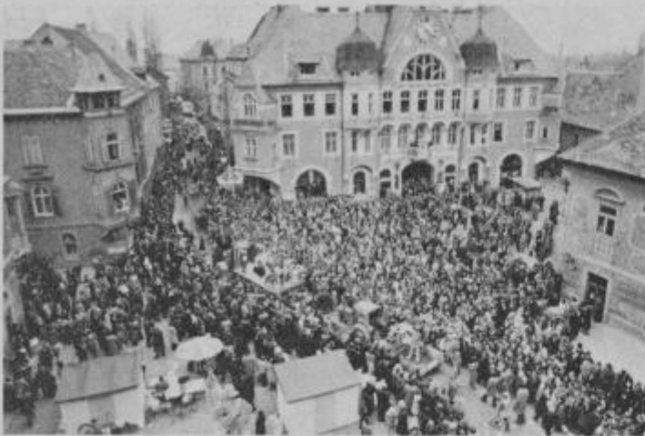
Množice so napolnile ulice in trge

V nedeljo, 4. marca, na dan letošnjega kurentovanja, je bilo ptujsko mesto že zjutraj zelo živahno. Ljudje so se sprehajali in si ogledovali blago na stojnicah, ki so ga prodajalci kar prevsiljivo ponujali. Največ pa je bilo kramarjev, ristik z bliščem in sijajem, toda ničvrednim blagom. Seveda tudi mask, klobukov in vseh drugih pustnih pripomočkov ni manjkalo. Stojnice s toplimi jedmi in pijačo so se med množico drugih kar skoraj izgubile, vendar so jih obiskovalci kljub temu našli in se pridno zalagali z dobrotami, ki jim jih je pripravila ptujska gostinska podjetja. Motilo nas je, da se trgovci v nedeljo niso znašli in so imeli trgovine zaprte, čeprav bi jim nekaj desetisočglava množica gotovo prinesla precej dohodka.