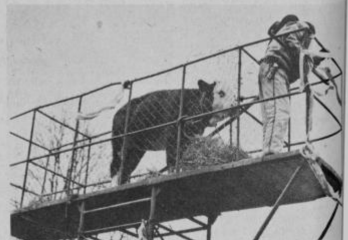
„Glejte me, glejte, jedli me ne boste!“

Kopjanji iz Markovec so možili Miciko, najstarejše delke in vasi. Na vprašanje, ali je nevesta kaj bogata, so njeni spremljevalci odgovorili, da