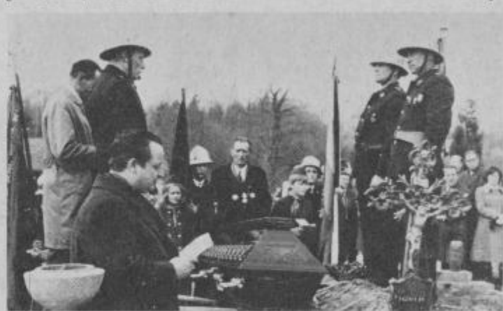
Posnetek s pogrebne svečanosti na pokopališču v Cirkulanah

Februarja 1939 je bil sprejet v KPJ in je ostal vseskozi njen zvesti član. Po vdoru okupatorja je bil med prvimi organizatorji Osvobodilne fronte v Halozah. Bil je