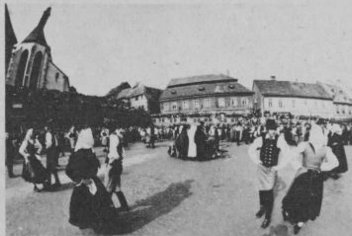
Nastop folklornih skupin na živilskem trgu

Kopjaši iz Markovec, druga etnografska skupina, ki je nastopila