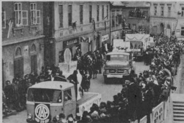
Karnevalska povorka na pothodu

Ob desetih dopoldne se je začel folklorni del kurentovanja. Ljudje so se prerivali okoli trga, si iskali