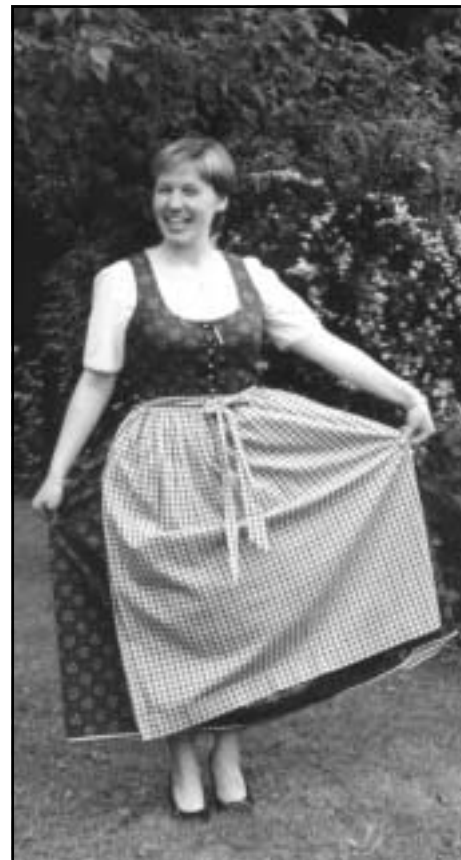
Tipična bavarska obleka za ženske - dirndl. Po tem so me Bavarci vzeli za svojo