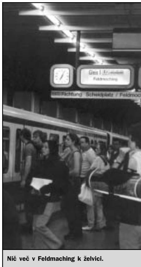
Nič več v Feldmoching k želvici.