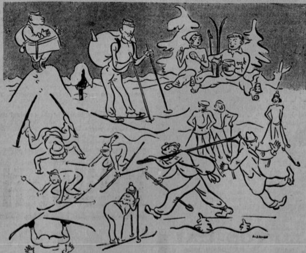
Zimski sport po gestu: Vsak po svoje!

Lastnik velike modne trgovine v Newyorku je sklenil, da se umakne v zasebno življenje, ker si je v trgovini toliko pridobil, da bo poslej lahko živel od obresti. Ob tej priliki se je hotel izkazati hvaležnega svojim trgovskim pomočnicam, ki so dejansko opravljale glavno delo v trgovini. Prepustil jim je prodajalno z vso opremo v vrednosti 25.000 dolarjev. Dekleta, pet po številu, bodo mogle voditi sedaj trgovino na svoj lastni račun.