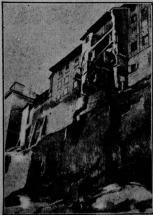
Skalni podor v Freiburgu v Švici. V sredini mesta Freiburgu v Švici se je utrgalo 2000 kubičnih metrov skalovlja in zgrmelo v globčino. Več hiš se je podrla, eno žensko je ubilo.

Drug slaven dušeslovec je zamislil nekoliko drugačen način: on je svoje ljudi brezobzirno nahrulil in se potem opravičil. Sodil jih je po tem, v koliko so se razburili, kako so odgovarjali. V teku časa si je sestavil cel slovar vzklikov svojih žrtev in povsodi zraven dostavil, kakšnih lastnosti je človek, ki odgovarja na tak način.