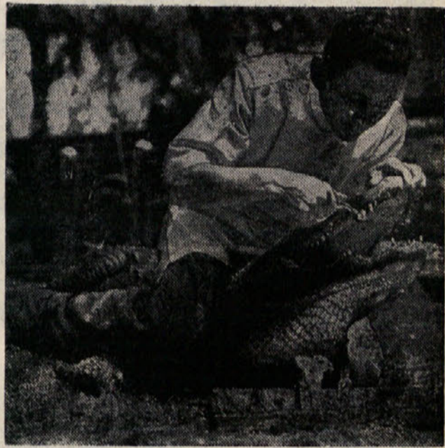
Zdravnik puli aligatorju slabe zobe

nejo pariti. Takrat samci hudo rjovejo in se grizejo med seboj. Samica zleže 60 do 100 jajc v mehka tla in jih nato zakoplje. Mesto, kjer so zakopana jajca, samica zelo skrbno čuva. Srdito brani zarod pred napadalci. Ravno tako lepo ravna z mladiči, ko se izležjo iz jajc. Spočetka jih povede k mlaki in šele potem, ko se jim oklep nekoliko utrdi, jih povede v jezero ali reko. Kljub skrbnem varstvu samica ne more obvarovati vseh mladičev pred sovražniki, ostane jih le polovica,