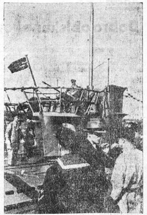
Nemški podmornici se pripravljata na nove akcije v podmorniški vojni

od njih je bil Hayes. S šestimi ali sedmimi od njih je vodil zelo intimne stike in razpravljal z njimi v živahnih debatah o zunanjepolitičnem položaju. Butler si je zmerom prizadeval, da bi USA vodila energično akcijo za mir in povzdigo sveta. Čeprav je po izvoru republikanec, je odobral Rooseveltove reforme in je pristaš Huilovih prizadevanj za obnovo miru in zmago pravičnosti v svetu.