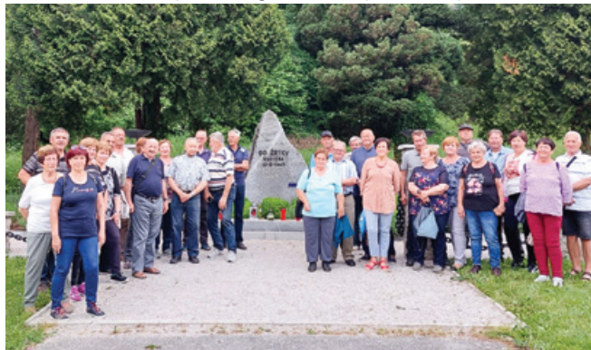
Udeleženci izleta na Vršič so se ustavili tudi v Frankolovem.

Člani ZB Murska Sobota se skupaj z ZB Lendava in člani Društva Slovenija Rusija vsako leto udeležimo slovesnosti pri Ruski kapelici na Vršiču. Povezujeta nas dva simbola: kapelica padlim ruskim vojakom v prvi svetovni vojni in spomenik zmage v središču Murske Sobotje, posvečen padlim partizanom in rdečearmejcem v drugi svetovni vojni. Začetek je bil skromen, in