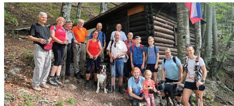
Skupina udeležencev pohoda do bolnišnice Košuta