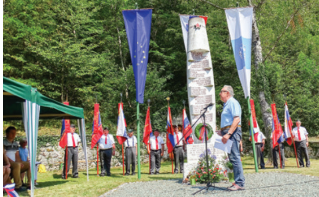
Spominska slovesnost v Kokri