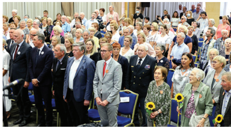
Srečanja se je udeležilo tudi nekaj preživelih taboriščnic in drugih udeležencev narodnoosvobodilnega boja.