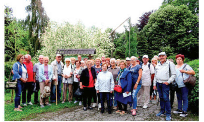
Člani Združenja v Vrta spominov in tovarštva, v ozadju je cvetoča japonška vrba.

Člani Združenja borcev za vrednote NOB Izola smo se 10. junija odpravili na tradicionalni obisk k prekmurskim soborcem za vrednote narodnoosvobodilnega boja. Dvodnevni izlet smo izkoristili še za ogled nekaterih znamenitosti na Goričkem, obiskali smo naše rojake na Madžarskem, zadnji dan pa prisostvovali proslavi stoletnice Društva Primorci in Istrani v Prekmurju v vasi Benica, ki leži prav v »kljunu« Slovenije. Primorci in Istrani so se v najbolj vzhodni del Slovenije preseljevali kot begunci prve svetovne vojne in zaradi fašističnega preganjanja.