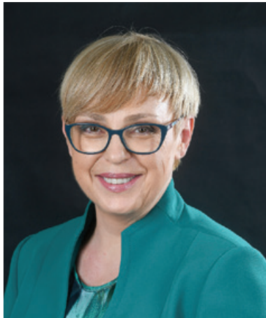
Nataša Pirc Musar

V nedeljo, 23. oktobra, bomo državljani Republike Slovenije že drugič letos odšli na volitve. Tokrat bomo izbirali predsednika oziroma predsednico republike. Od njega/nje pričakujemo, da nas bo dostojno predstavljala/a v sosesčini in svetu, da si bo tam prizadeval/a za uresničevanje naših interesov in da nas bo doma s svojim zgledom, javnim delovanjem in avtoriteto usmerjal/a k temeljnim evropskim vrednotam, opozarjal/a oblast na nedopustna ravnanja in nas povezoval/a v trdno in v prihodnost usmerjeno skupnost.