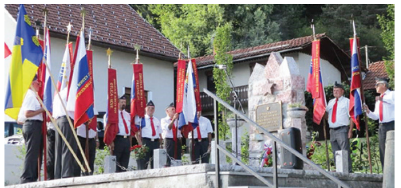
Obnovljeno spominsko obeležje

Spominsko obeležje, za katero sicer vzorno skrbi Ribiška družina iz Žirov, je bilo letos obsežneje obnovljeno. V občinskem proračunu za leto 2022 je bilo za obnovo tega spomenika in novo zasaditev rezervirano 6.500 evrov. Sami smo poskrbeli za odstranitev stare zasaditve, izkop sadilnega kanala in še nekaj manjših del za ureditev okolice. Spomenik, sestavljen iz kamnitih delov, je bil razstavljen,