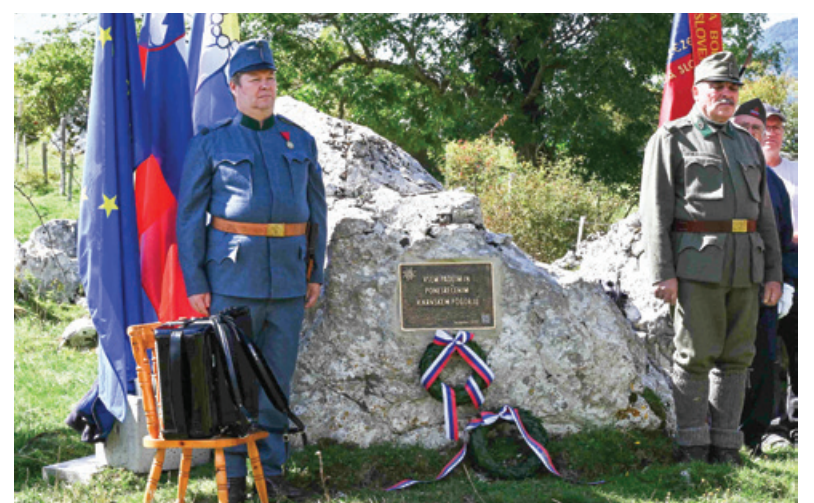
Na planini Kuhinji pod Krnom so odkrili spominsko obeležje padlim v prvi in drugi svetovni vojni.