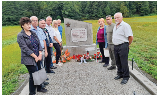
Obnovljeno spominsko obeležje

Obmejna vasica na hrvaški strani reke Čabranke Plešce je bila v začetku avgusta leta 1942 kraj zločina nad civilnim slovenskim prebivalstvom. V roški ofenzivi je bilo tega veliko, okupator ni prizanašal nikomur. Posebnost tega zločina je, da je bilo tu umorjenih deset naključno izbranih moških iz vasi Črni Potok na slovenski strani. Pet desetletij, kolikor je obeležje stalo na kraju zločina, se je zelo poznalo in zob časa bi izbrisal spomin na še en zločin. Več let so z različnih strani prihajale pobude za obnovo, toda meja, epidemija, predvsem pa pomanjkanje denarja so bili velika ovira. Razumevanje slovenskega ministrstva za obrambo in občine Kočevje je bilo odločilno za začetek obnove. Člani ZB za vrednote NOB iz Kočevja in Osilnice so si skupaj z združenjem antifašistov iz občine Čabar razdelili delo in s pomočjo Kamnoseštva Erjavec iz Kočevja je bila obnova izpeljana.