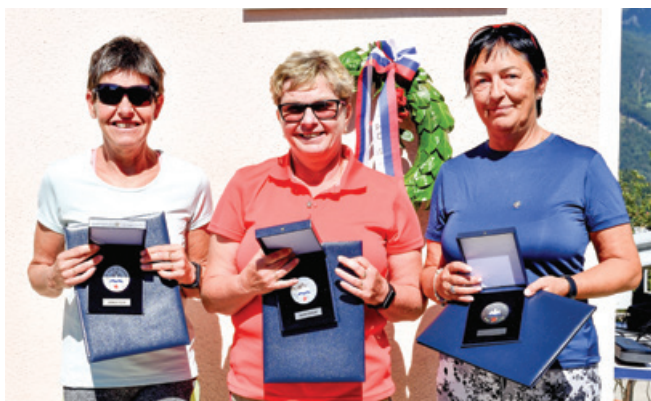
Prejemnice srebrnih plaket ZB NOB Slovenije