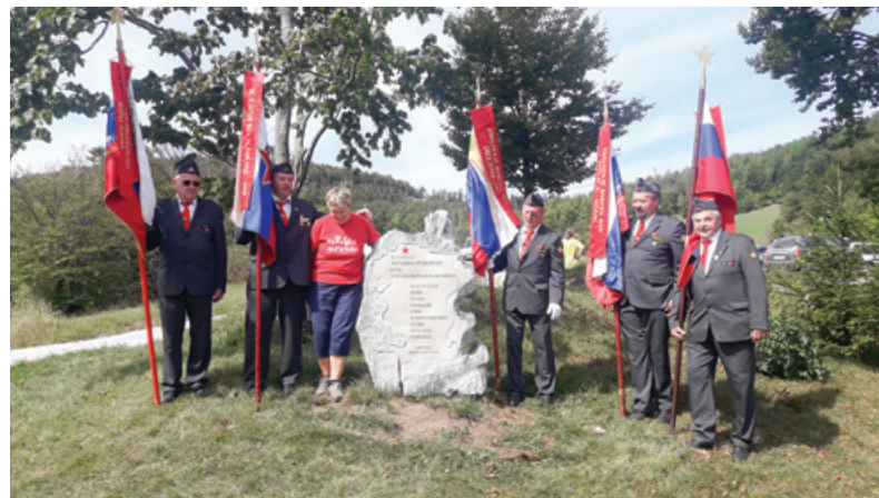
Spominsko obeležje himni na Križni gori.