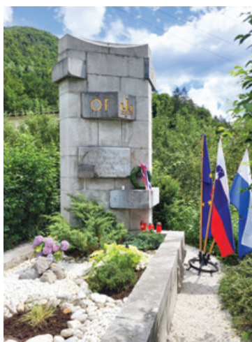
Grobnica je bila postavljena leta 1949.