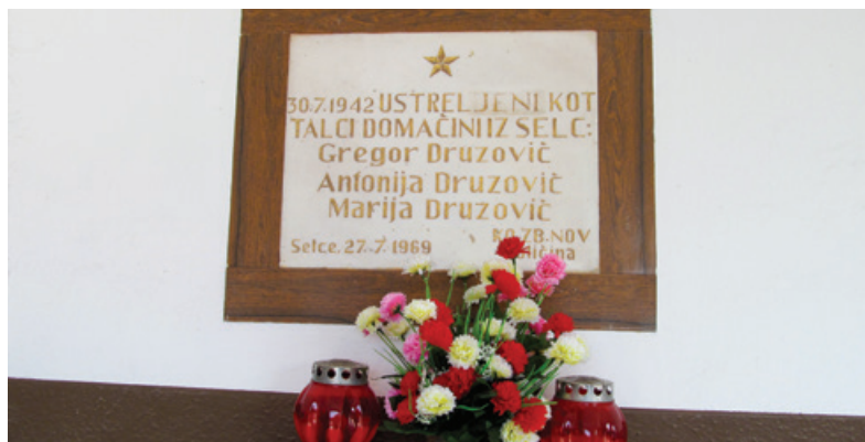
Spomin na ustreljene člane družine Druzovič v Selcih niti po 80 letih ni pozabljen