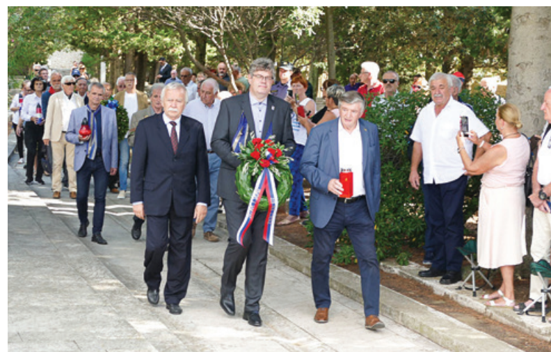
Delegacija ZZB NOB Slovenije, Koordinacijskega odbora žrtev vojnega nasilja in Taboriščnega odbora Rab-Gonars je pri osrednjem spomeniku in spominski plošči z imeni umrlih položila venec in cvetje ter prižgala sveče.