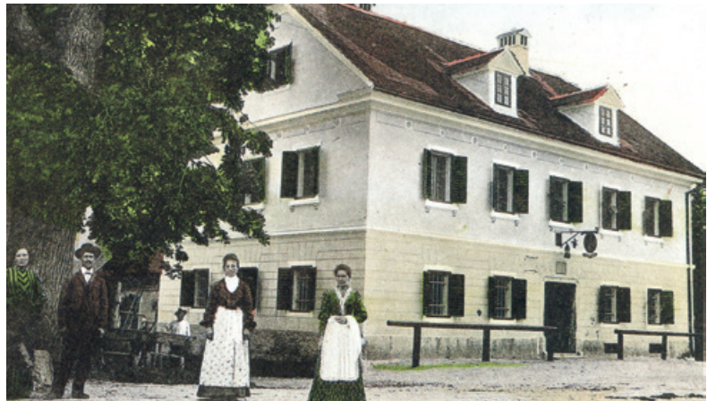
Gostilna Ruski car pred več kot sto leti

rodno zavednih in panslovansko usmerjenih razumnikov.