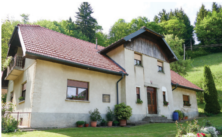
Kisovarjeva domačija, Miklavž pri Taboru

Kisovarjeva domačija leži v kotlini, ki se za hišo zapira v gozdno strmino, pred domačijo pa se odpira v ozko dolinico med njho-