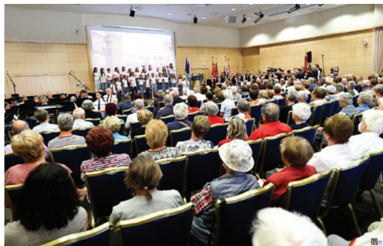
Tradicionalno srečanje v Portorožu je privabilo veliko obiskovalcev iz Slovenije in zamejstva.

»Nikoli na vprašanje, kako so, niso odgovorile s sovraštvom, vedno z ljubeznijo. In če one ne govorijo s sovraštvom, pa imajo morda za to razlog, mi tega ne smemo dovoliti sami sebi,« je med drugim poudaril slavnostni govornik, predsednik Republike Slovenije Borut Pahor, 4. septembra na tradicionalnem srečanju taboriščnic in taboriščnikov, ukradenih otrok, izgnancev in drugih žrtev vojnega nasilja v Portorožu.