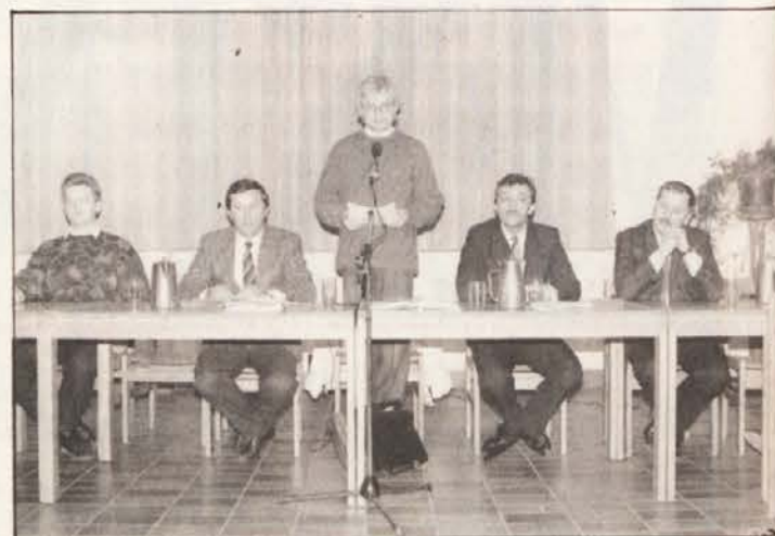
Predstavniki obeh osrednjih organizacij...