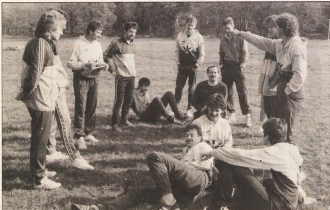
Na pripravi je Slovenski atletski klub dodelal svojo linijo.