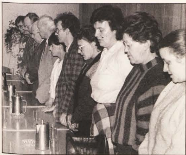
...so se skupaj z odborniki spomnili dogodkov izpred 50 let in žrtev nacizma.

lacijsko politiko krojijo tiste sile, ki se z antifašistično zmago še danes niso sprijaznile!