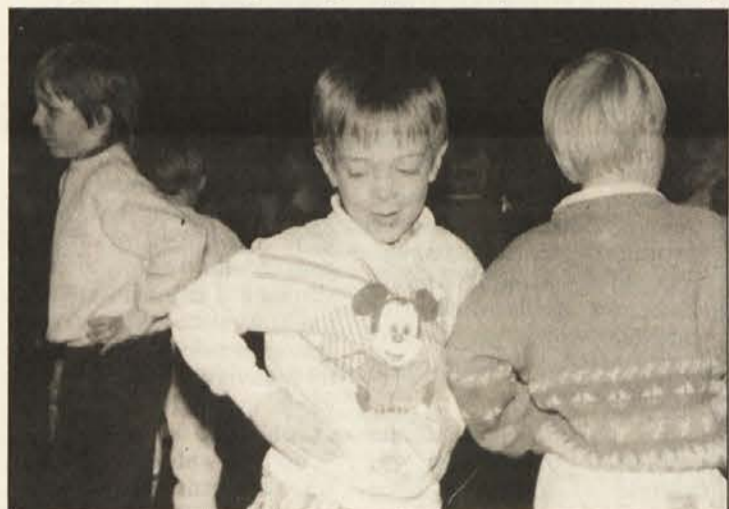
Najprisrčnejši pozdrav slovenskim ženam so izrazili varovanci otoškega vrtca.