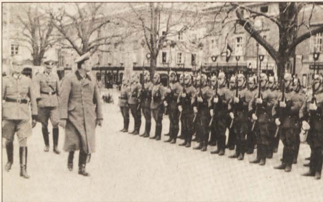
Iz Porenja so v Celovec pripeljali močne policijske enote.