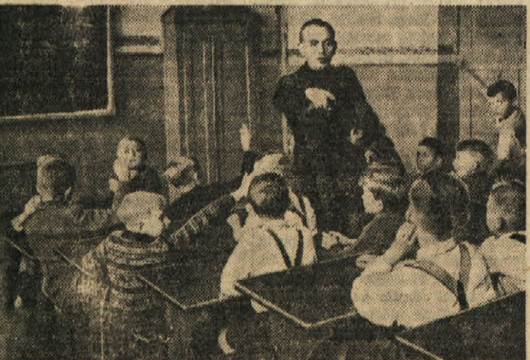
V britanskem taborišnem področju so spet odprli nemške osnovne šole. Učitelje so izbrali zelo skrbno. Nova zavezniška vojaška politika hoče namreč odpraviti vsako sled nacizma in iz nemške mladine vzgajati svobodne in demokratične ljudi. Slika kaže pouk v osnovni šoli v Iserlohm.

Eno pa je pri naših poskusch preusmerjevanja nemškega naroda gotovo: da naši naporu nikomur ne bodo škodili. Če se bo preusmerjevanje nadaljevalo, imamo vedno več upanja, da se bo iz tega rodilo nekaj dobrega.